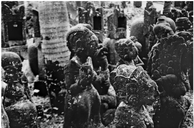
Schützen stehen für die Götter der Unterwelt auf dem Weg zum Heiligtum Sono Shamhula im Dorf Pajagan

Niemand, der diesen Hof betritt, muss leere Hände, bis er Kera Lijer verlässt. Meist sitzt der Klerik und Schamanen, ganz in Weiss gekleidet, auf dem Boden einer der kleinen Veranden und blickt aus mit den, für diese Augen in Richtung Engpässen, Dutzende Menschen – vor allem Frauen aus westlichen Ländern – kommen täglich in diesen Hof, den reich ornamentierten, eingeschobenen Wehrtürmen und der Hauswand schimmern.