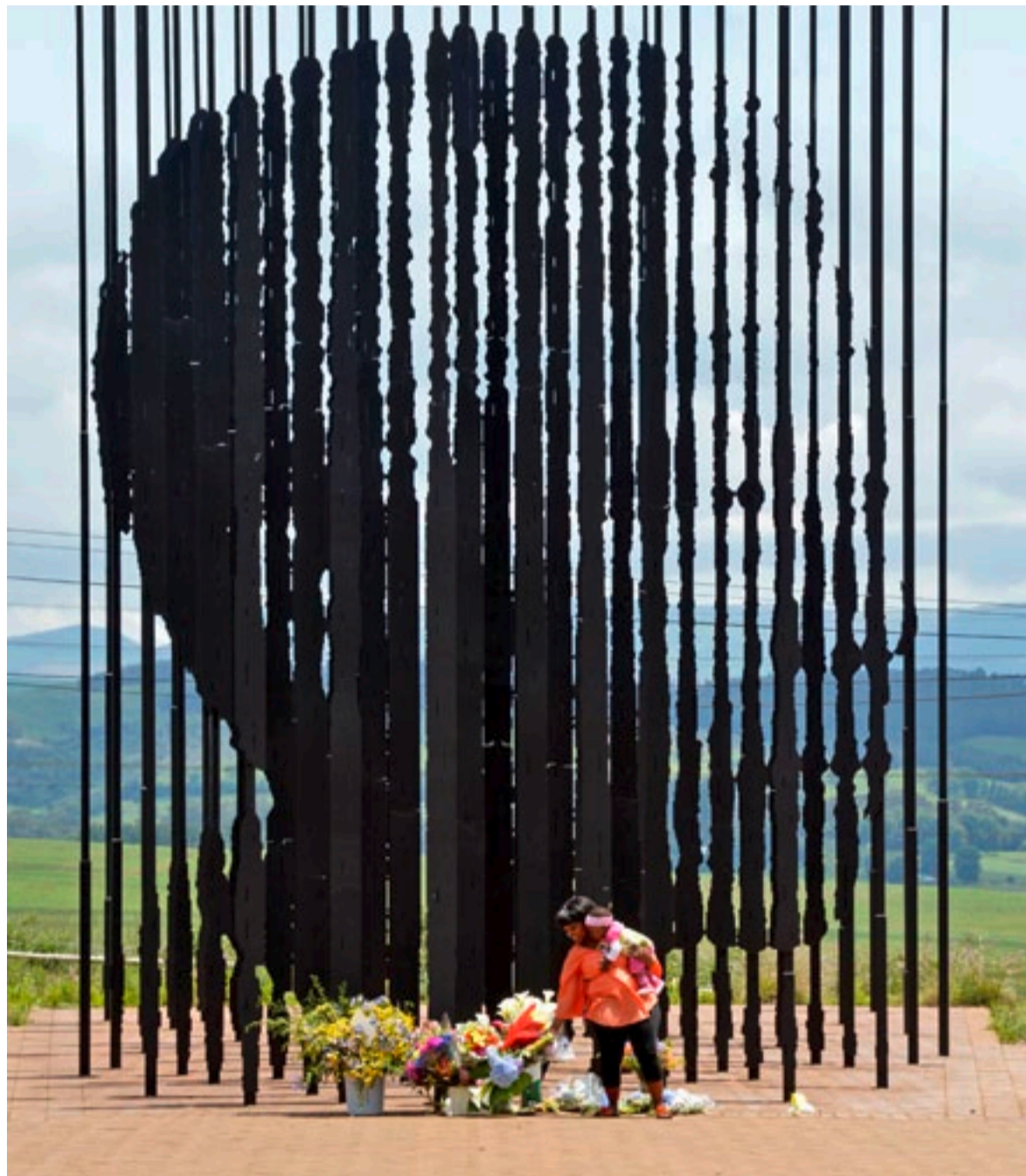
Das Denkmal in der Nähe von Howick, wo Nelson Mandela im August 1962 verhaftet wurde

Wollten die Weissen vorher einen Staat mit klarer Separation der Stämme und Völker haben, sah Mandela die Mischkulturen als Weg zur Integration ins Ganze. Bestimmte Weltreligionen waren im Gegensatz zu Afrika auf Reinheit aus. Das Christentum kennt sogar die Erbsünde, die annimmt, dass die Menschen seit Beginn befleckt sind. So etwas