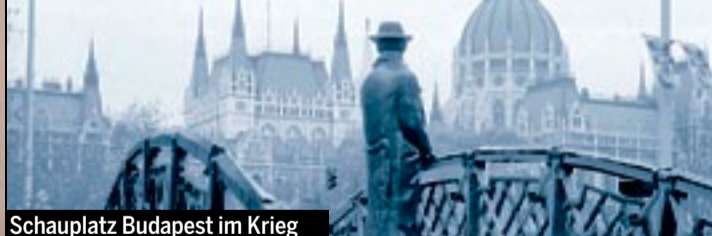
Schauplatz Budapest im Krieg