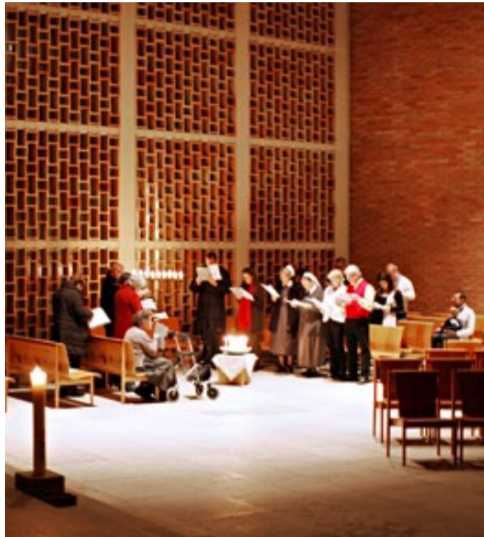
Klösterliche Liturgie morgens um 7 Uhr in der Bullingerkirche

STADTKLOSTER/ Noch ist die Gründung eines reformierten Klosters in der Stadt Zürich Zukunftsmusik. Das Klosterleben wird aber bereits eingeübt.