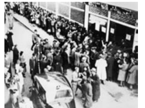
Schutzsuchende vor der Botschaft