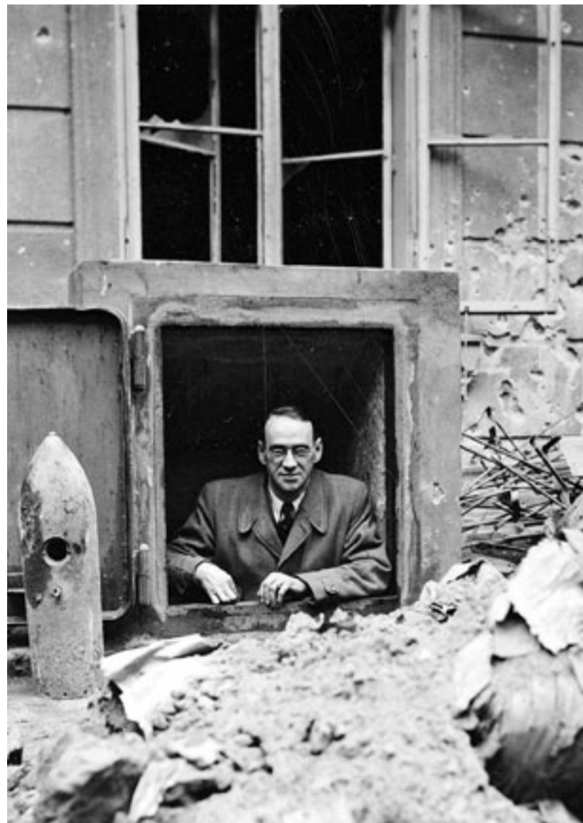
Carl Lutz in seiner zerbombten Residenz in Budapest

AUSSTELLUNG/ Carl Lutz war von 1942 bis 1945 Schweizer Vizekonsul in Budapest. Der Diplomat nutzte seine Stellung, um Tausende von Juden zu retten. Nun erinnert eine Ausstellung an seine Zeit in Ungarn.