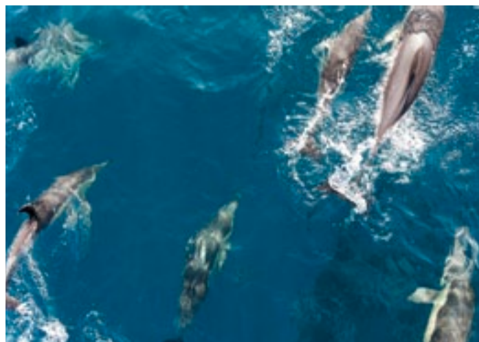
Delfine müssen frei sein. Für andere Tiere gelten andere Regeln

FREUNDE. Oder doch nicht so schlecht? Immerhin dokumentiert die Lex Connyland, dass das Tier in der Politik hohe Freunde hat. Sind es nicht schon zwei Jahrzehnte, in denen die Bundesverfassung im Artikel 120 die «Würde der Kreatur» schützt? Und hat sie nicht Eingang