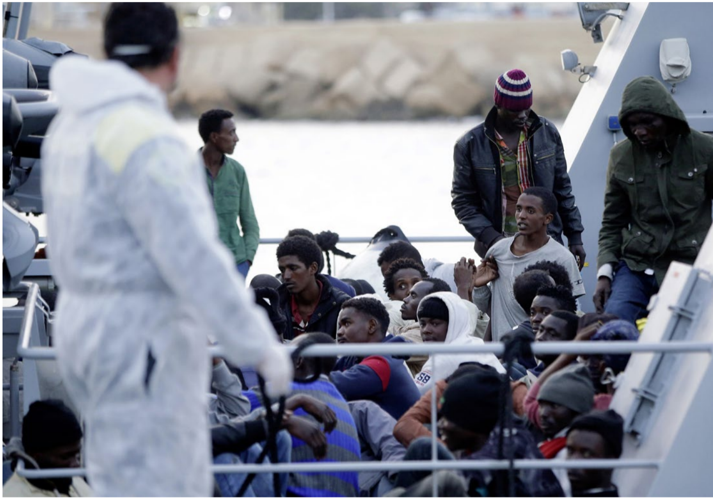
Tagtäglich erreichen mit Flüchtlingen gefüllte Boote die kleine Mittelmeerinsel Lampedusa

FLÜCHTLINGE/ Die italienischen Protestanten setzen sich für eine würdige Betreuung der Flüchtlinge ein. Auf der Mittelmeerinsel Lampedusa sind sie mit einer Beobachtungsstelle präsent.