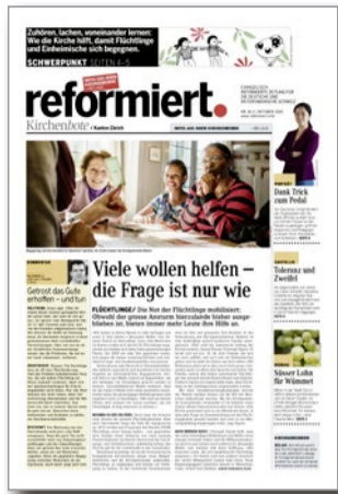
REFORMIERT. 10.2/2015 SEBASTIAN CASTELLIO. Vorkämpfer für religiöse Toleranz