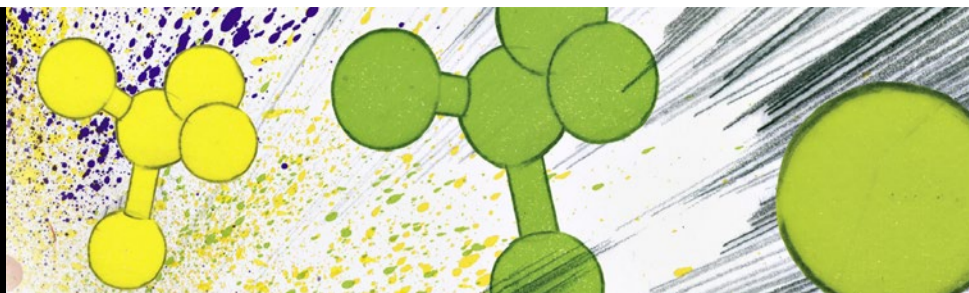
ILLUSTRATION: RAHEL NICOLE EISENBERG