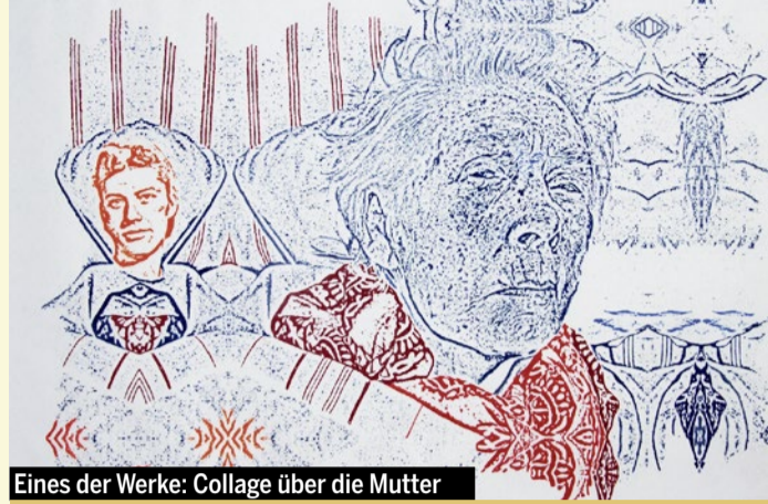
Eines der Werke: Collage über die Mutter