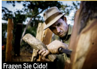
Fragen Sie Cido!