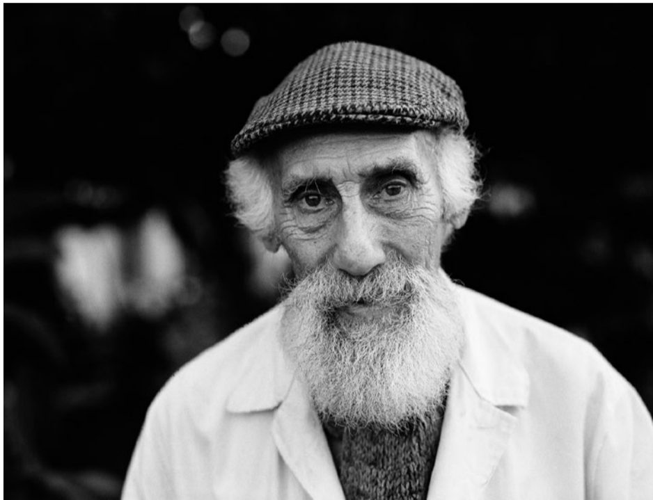
Warten auf die Gnade des Moments: Robert Lax (1915–2000)

LYRIK/ Der Dichter Robert Lax, der vor hundert Jahren geboren wurde, widmete die Aufmerksamkeit ganz dem Moment. Seine Lyrik ist eine Wahrnehmungsschule.