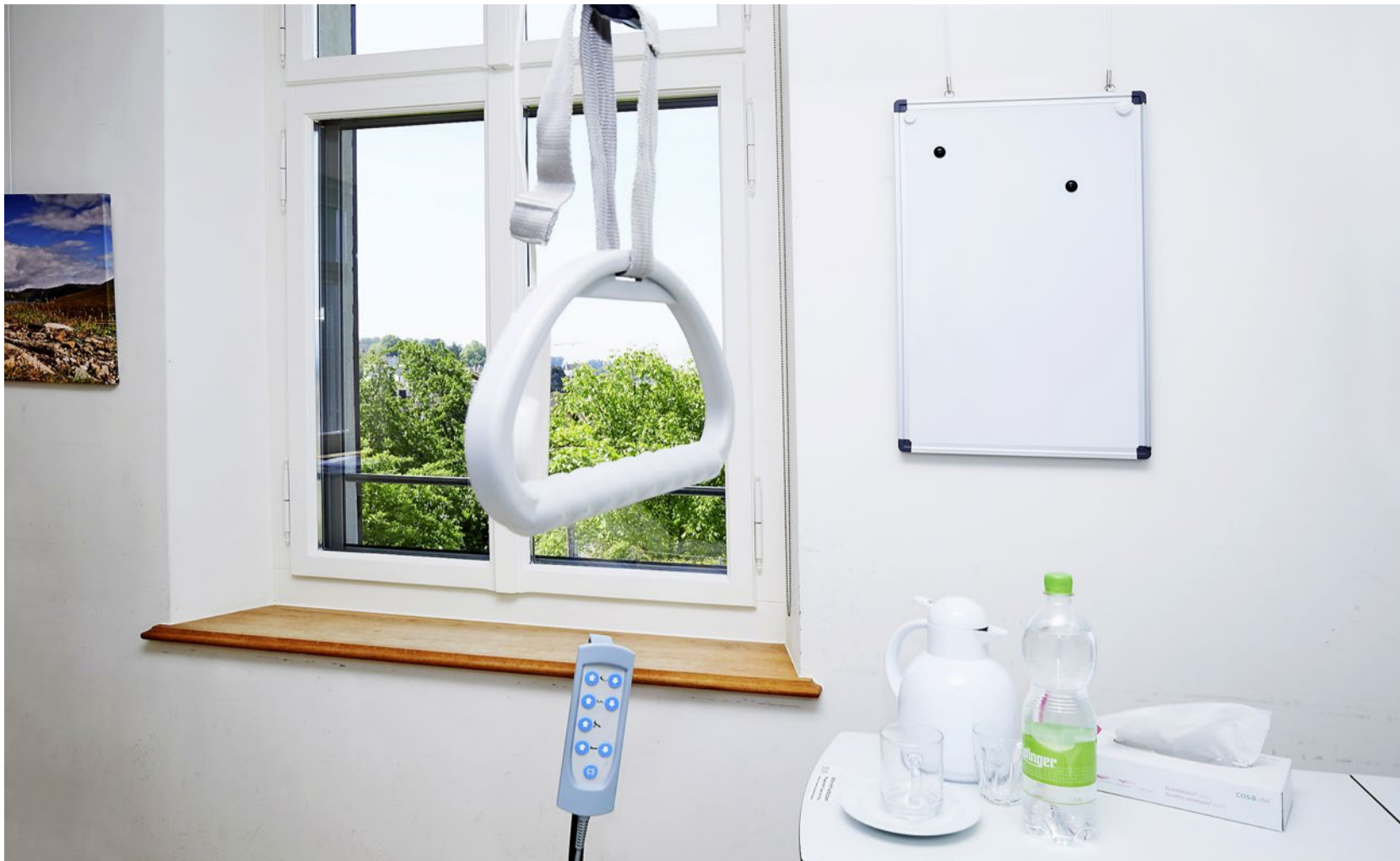
Auch die Wahrnehmung von Sterben und Tod wandelt sich mit der Zeit

von der Gesellschaft nicht mehr länger so hingenommen wurde.» Tatsächlich kann heute mithilfe der technologischen Möglichkeiten und durchgeführten Behandlungen das Leben von Schwerstkranken verlängert werden. Doch um welchen Preis? Während die Spitzenmedizin immer bahnbrechendere Erfolge vermeldet, ist bei den meisten Ärzten ein Bewusstseinswandel in die gegenteilige Richtung im Gang. Sie verzichten zunehmend auf lebensverlängernde Massnahmen am Lebensende, wie eine neue Studie belegt (siehe unten).