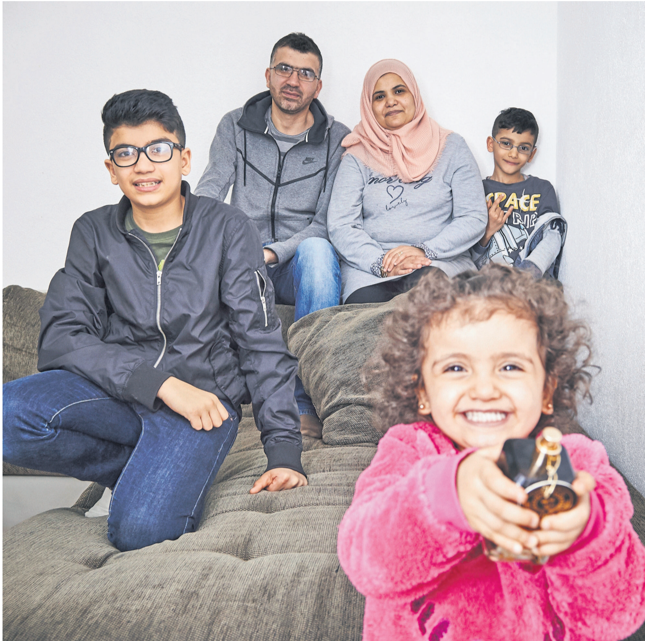
Die Jüngste kam in der Schweiz zur Welt. Ihre Unbekümmertheit ist für die Eltern ein Segen.

Syrien Die Syrer in der Schweiz leiden unter starkem Heimweh. Doch der Krieg in der Heimat wird immer komplexer, die Hoffnung auf eine Rückkehr schwindet. Wie geht ein Mensch damit um? Syrer aus dem Aargau erzählen.