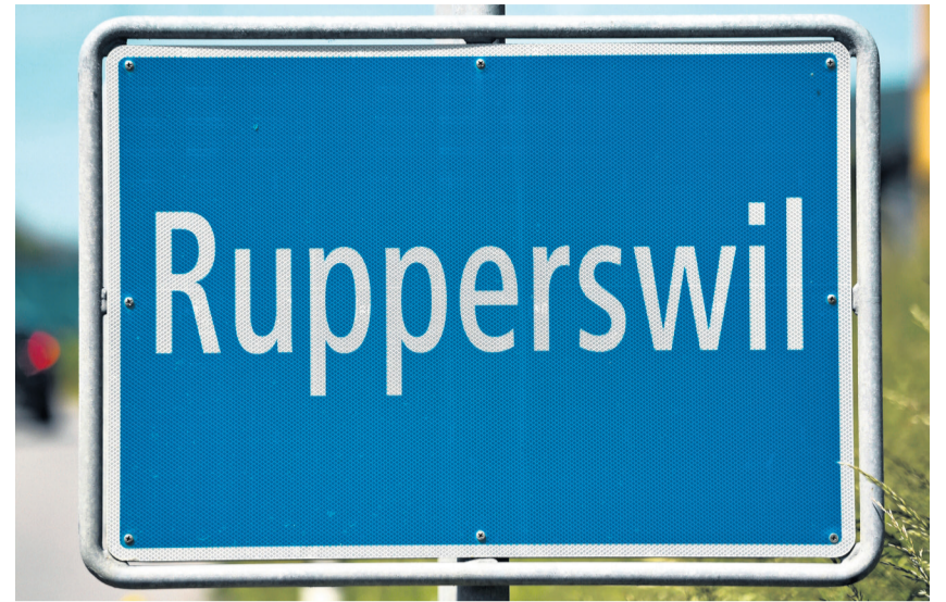
Die 5000-Seelen-Gemeinde kann einen Neuanfang wagen.