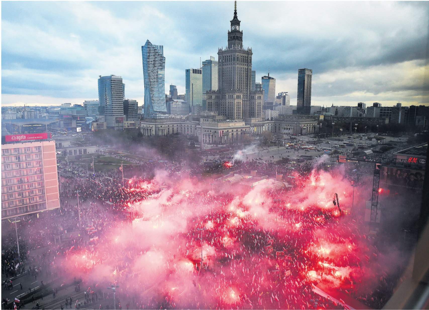
Pyrotechnik zum Nationalfeiertag: Unter die Demonstranten in Warschau mischten sich zahlreiche Rechtsextreme mit ihren Hetzparolen.