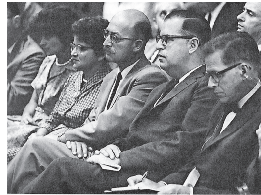
Less mit Frau und Tochter im Zuschauerraum des Gerichts.