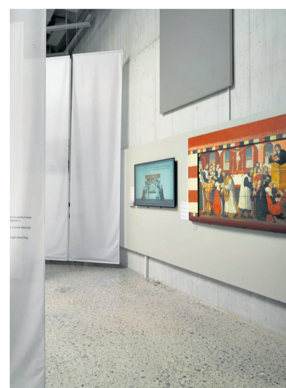
Was Gott wohl über die Heiligenbilder dachte?

Erika Hebeisen Verantwortliche Ausstellung