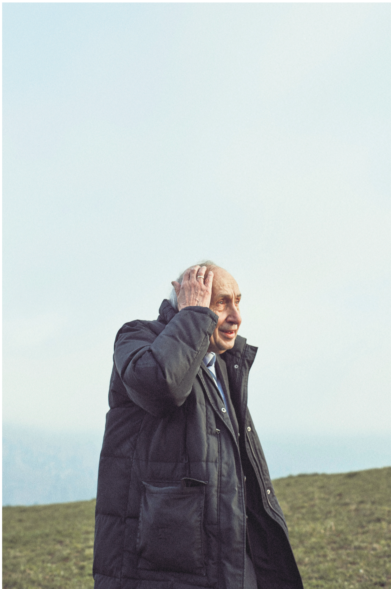
Der Theologe Eberhard Busch kritisiert seine Zunft, zu lange den Holocaust verdrängt zu haben.