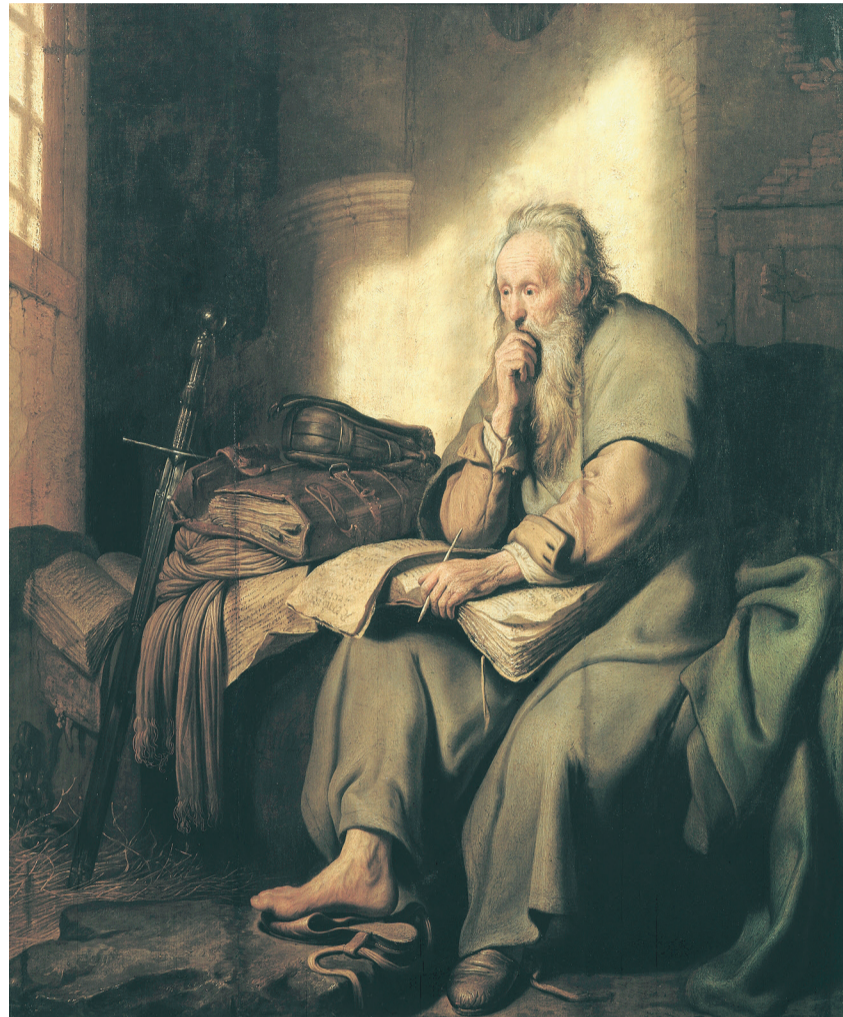
Rembrandt van Rijn: Paulus in Gefangenschaft.