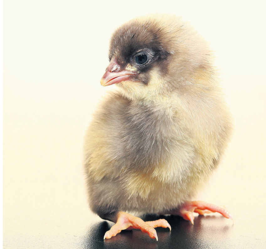
Das Naturama bringt Küken ins Museum.

Osterprogramm: Karfreitag bis Ostermontag, 30.3.–2.4., 10–17 Uhr. Naturama Aargau, Feerstrasse 17, Aarau. 062 832 72 00, www.naturama.ch