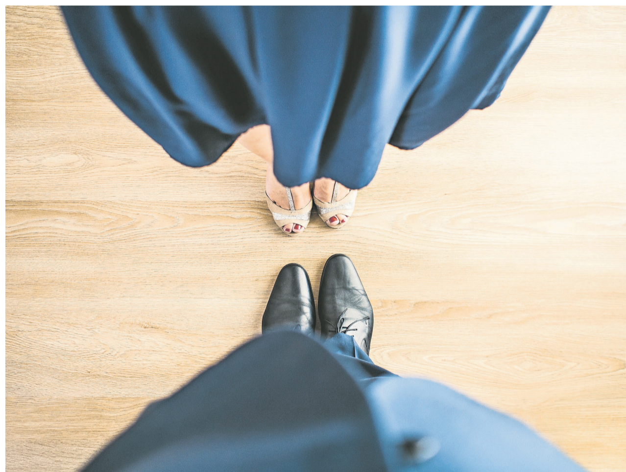
Gleicher Lohn für gleiche Arbeit: Alle sind dafür, doch Verbesserungsvorschläge haben es schwer.

Wie sieht es bei den reformierten Landeskirchen aus? Die Umfrage im Verbreitungsgebiet von «reformiert.» ergibt, dass die Kirchen