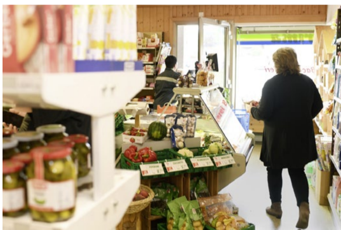
Beim Einkauf im Dorfladen.