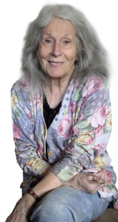
Linda Geiser ist bekannt aus Filmen wie «Die 6 Kummerbuben» oder dem TV-Hit «Lüthi und Blanc».

Bezirkskirchentag: 21./22. September, ab 9.30 Uhr, Mehrzweckhalle Lüterkofen www.bezirkskirchentag.ch