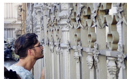
Religion für Neugierige.