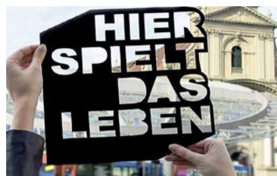
Feiern mit der Citykirche.