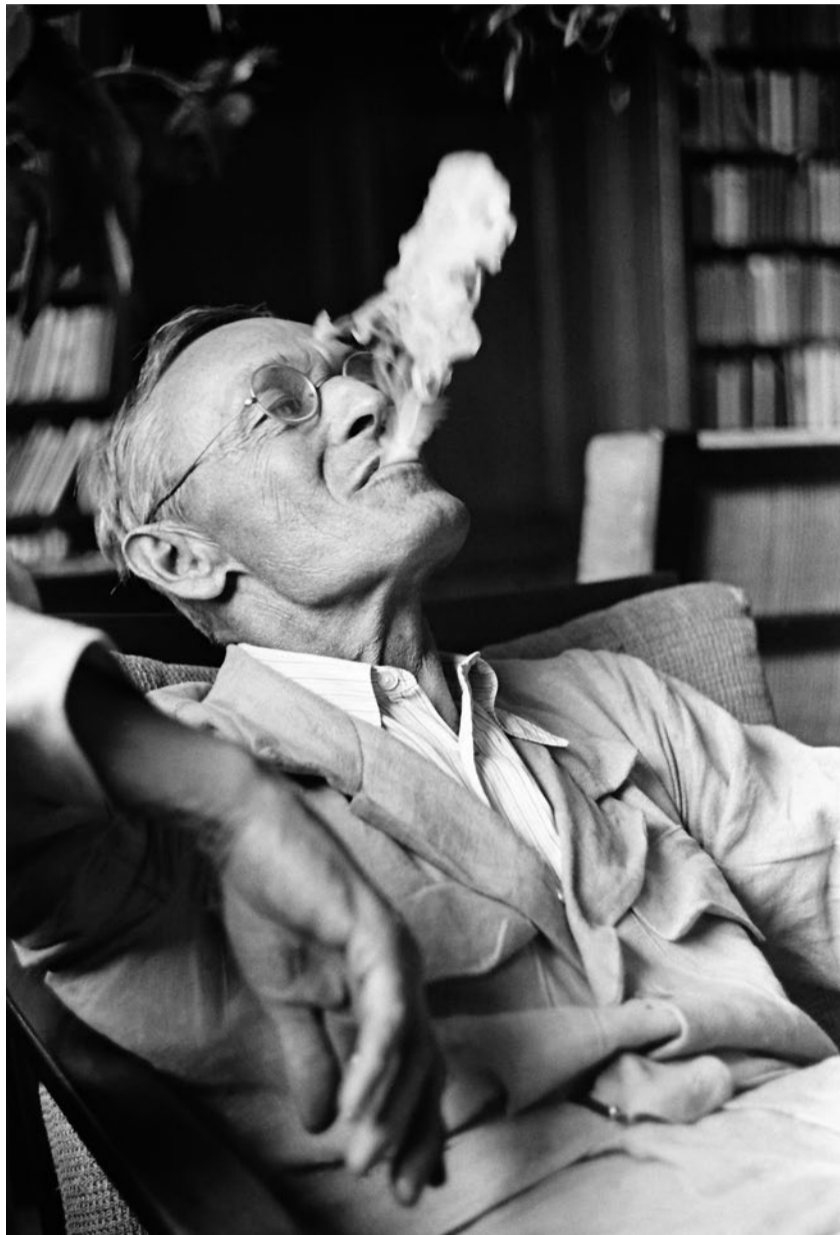
Vor 100 Jahren erschien Hermann Hesses Roman «Demian».

Seine Schriften sind geprägt von einer steten Auseinandersetzung mit den Fragen des Glaubens. Wieso? Hesse wuchs in einem protestantisch-pietistischen Haushalt auf.