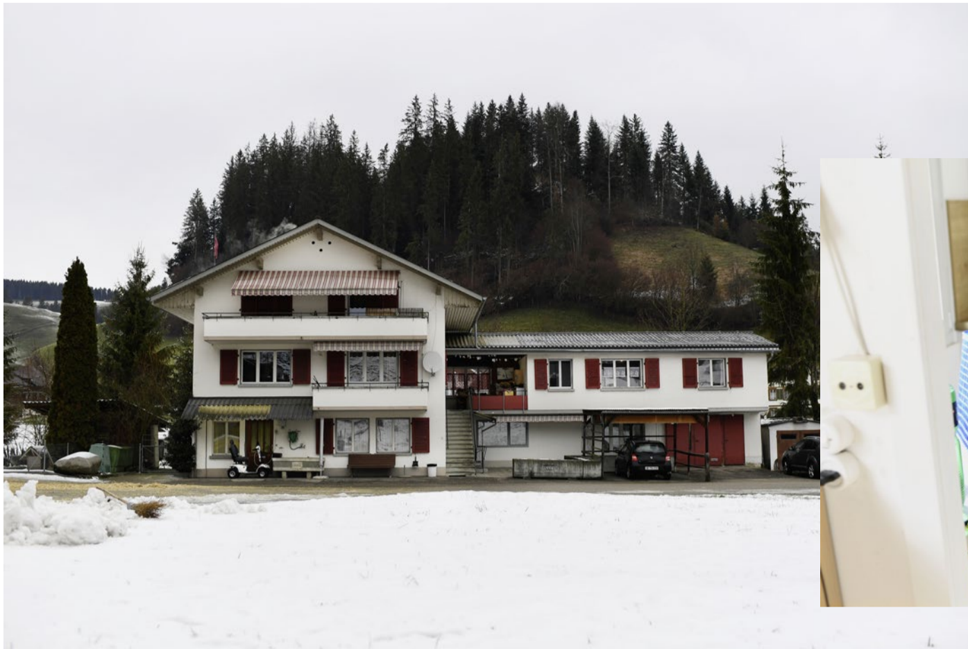
Das Haus mit der Dreizimmerwohnung der Sterchis.