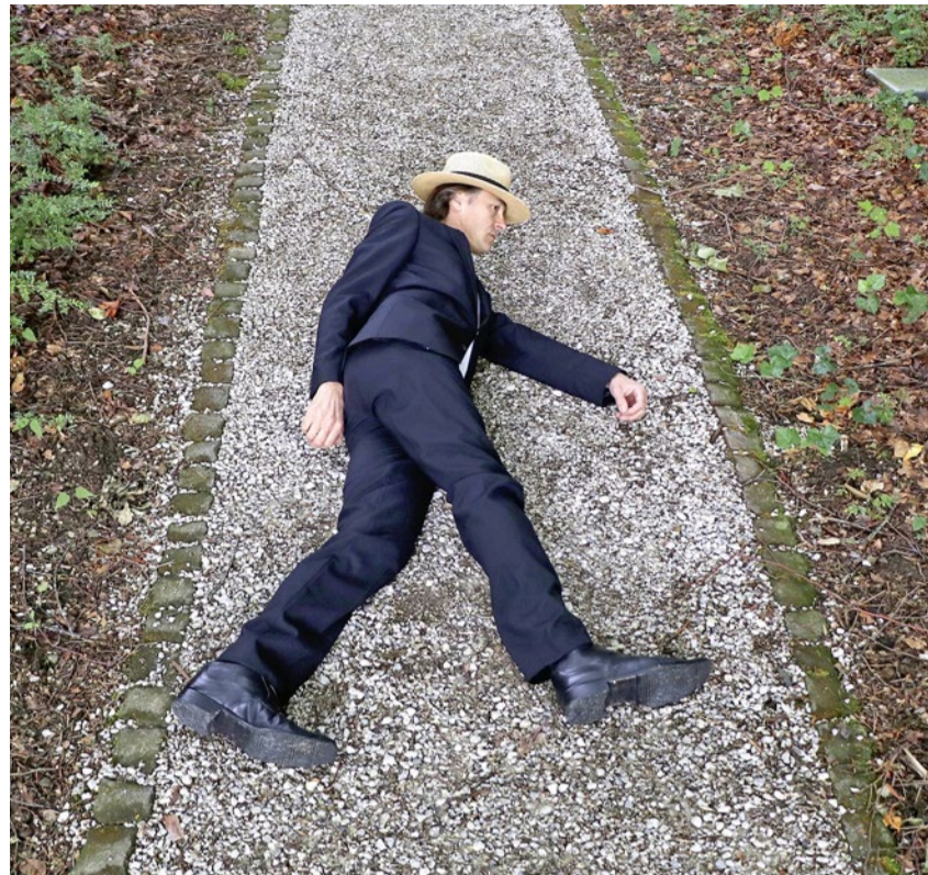
Der Friedhof als Kunstort für inszenierte Worte.

«Zeit los lassen», 21.9–24.11.19, Schosshaldenfriedhof Bern, Treffpunkt beim Haupteingang. www.matthiaszurbruegg.ch