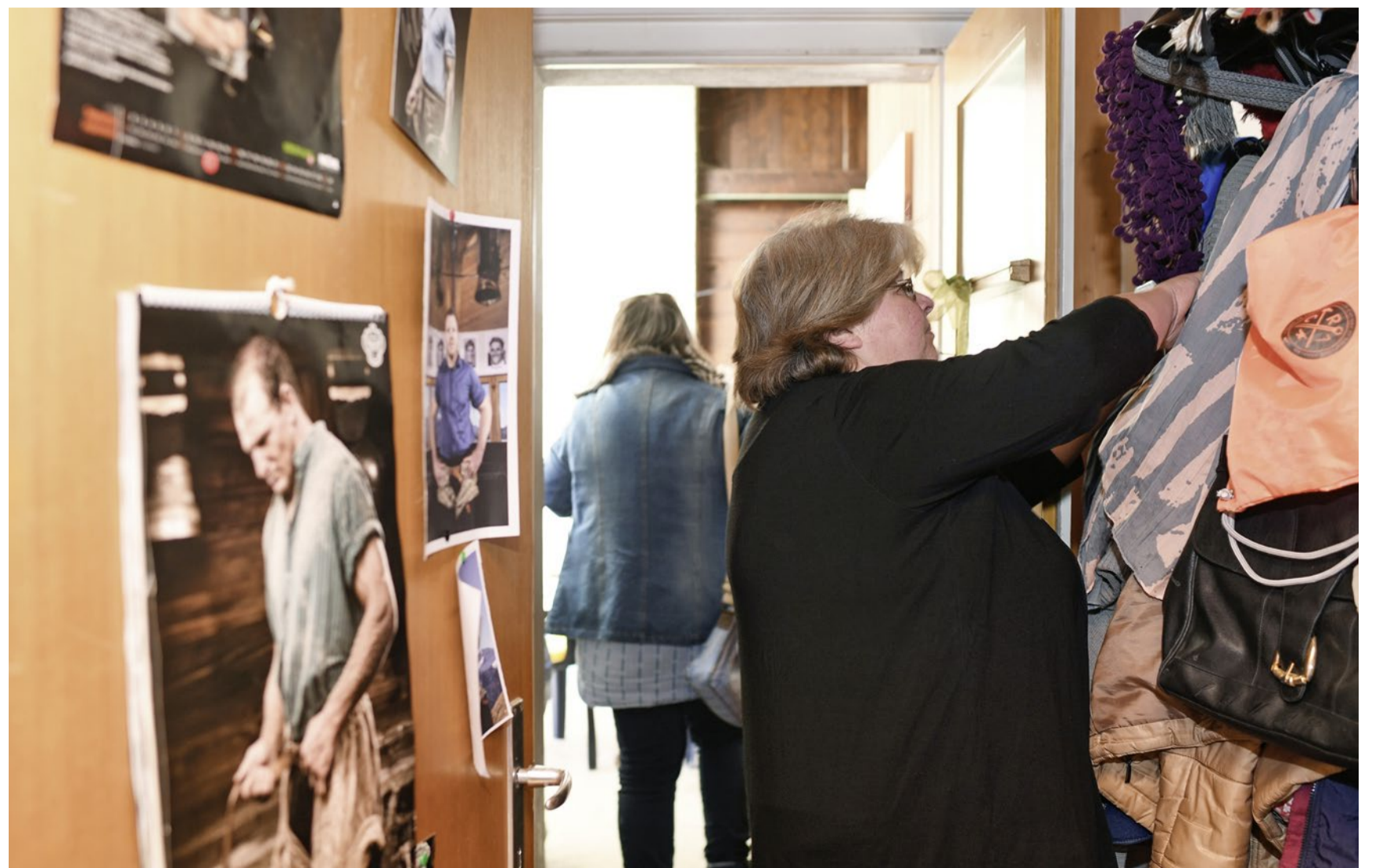
Der Alltag von Mutter und Tochter ist von Einschränkung und Verzicht geprägt – aber auch von Wünschen und Träumen.

«reformiert.» berichtet über eine Emmentalerin, die in Armut lebt. Zuerst war sie Wirtin in einem Landgasthof. Dann geriet sie wegen Ehe- und Alkoholproblemen in eine Abwärtsspirale und verlor alles, was ihr bisheriges Leben ausmachte. Bis auf die Tochter, die eine Behinderung hat, das Mitfiebern an Schwingfesten, das Jodeln und einen unbeugsamen Lebensmut, der sie durch schwierige Zeiten trägt.