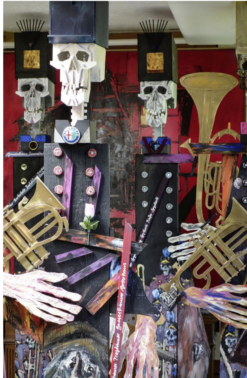
Lustig-makabre Musikanten rüsten zum Abgesang auf ihr Dorf.

Ortsgeschichte In der Kirche Münchenbuchsee steht eine besondere Uraufführung an: Das «Requiem für B» thematisiert in Bild, Ton und Wort den Verlust der traditionellen dörflichen Identität.