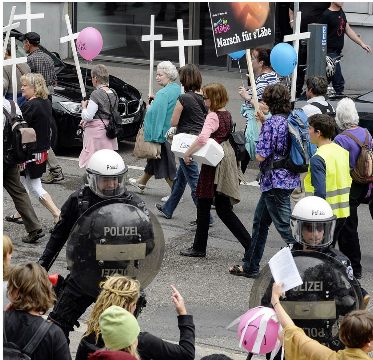
Ein massives Polizeiaufgebot begleitete 2013 den Demonstrationsumzug «Marsch fürs Läbe» in Zürich.

In Sachen Meinungsfreiheit dürfte sich «Christianity for today» bestätigt fühlen, denn Zürichs Stadtrat will den Marsch verbieten (Kasten). Seit 2010 findet die Demo fast jedes Jahr statt. Letztes Jahr mobilisierte sie in Bern 1500 Leute und wurde mit grosser Polizeipräsenz vor Gegendemos linksradikaler Kreise ge-