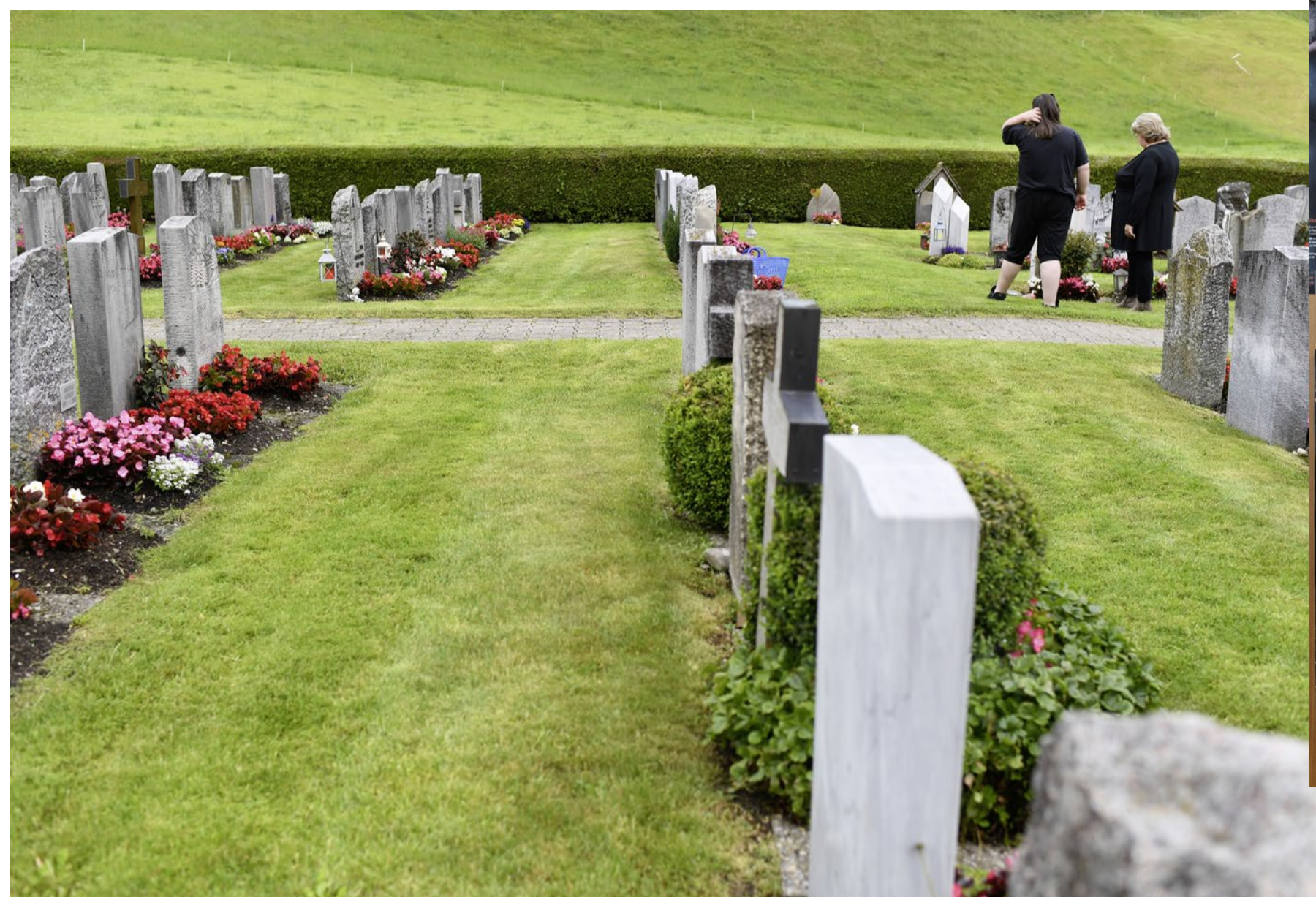
Am Grab des Vaters der Tochter.