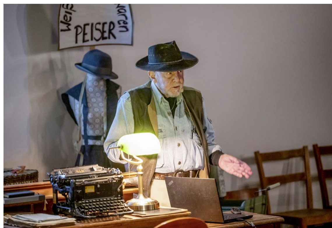
Hat mit den Stolpersteinen ein weltweites Projekt für Erinnerungsarbeit lanciert: Künstler Gunter Demnig.