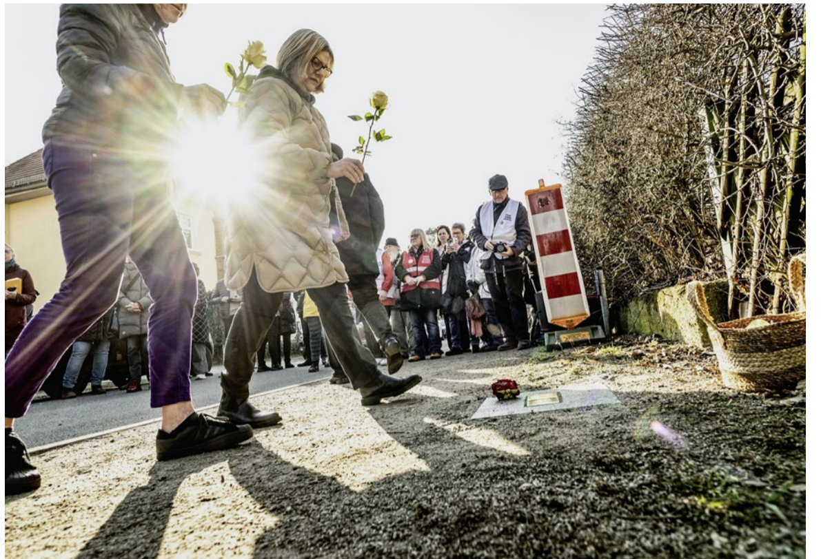
«Von Stolperstein zu Stolperstein werden wir mehr»: Gedenken heisst Widerstand.