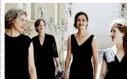
Ensemble Per-Sonat.