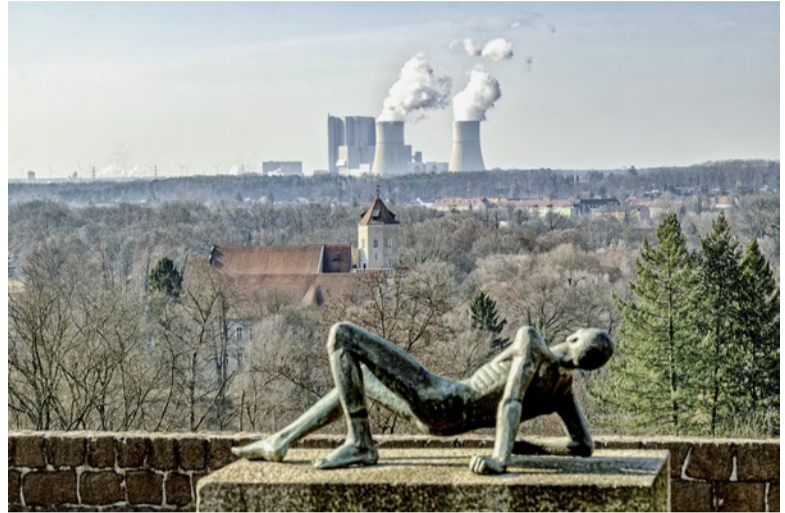
Die Stadt und das Kohlekraftwerk Schwarze Pumpe.