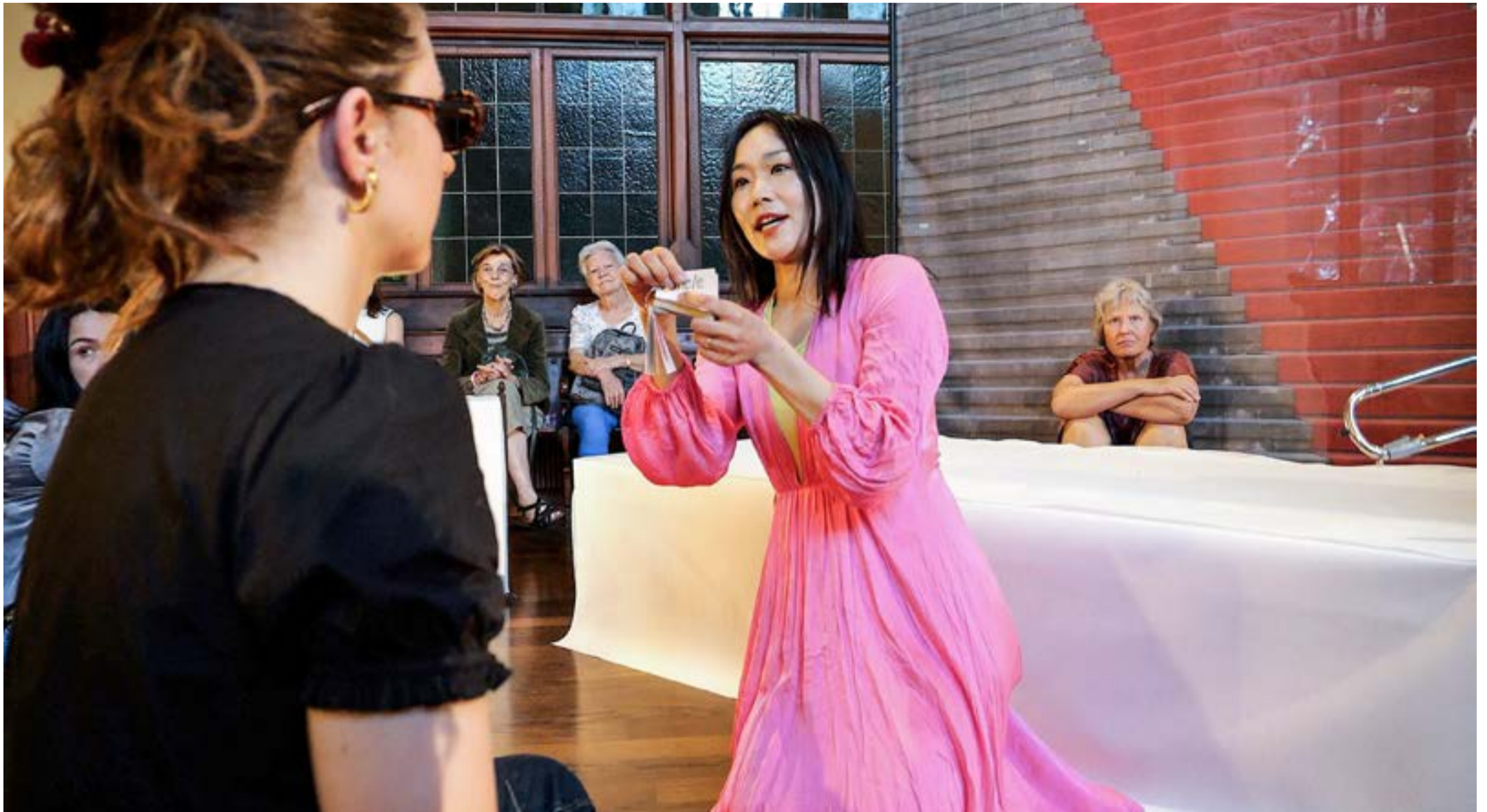
Intime Momente: Das Publikum pilgerte in Gruppen durch die Citykirche Offener St. Jakob.