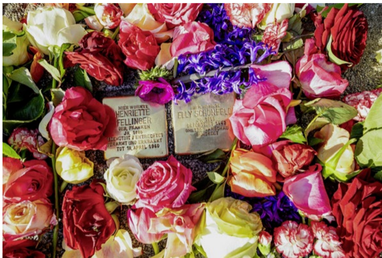
In Trauer über die eigene Geschichte.