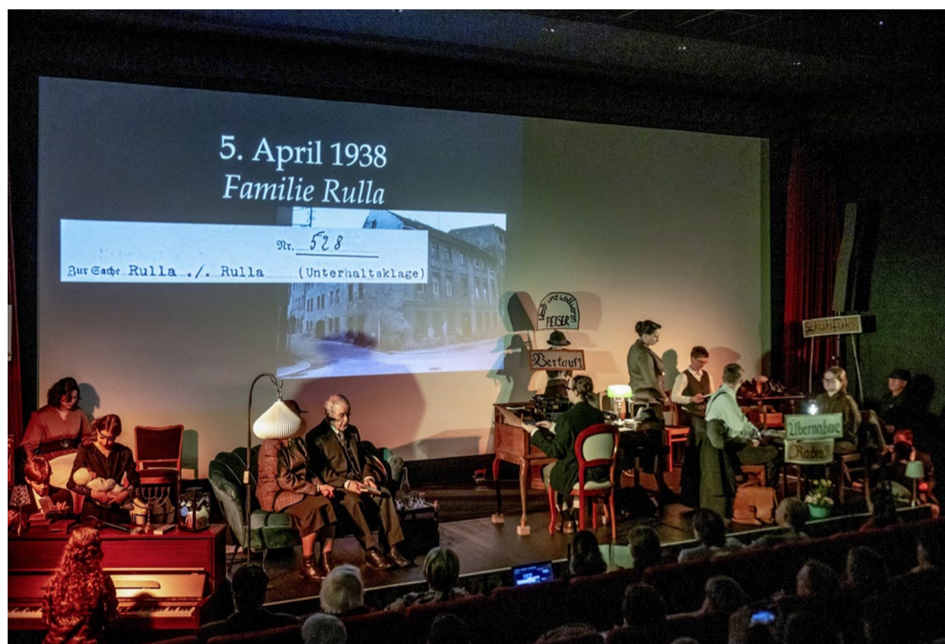
25 Bürger auf der Bühne: Das Spremberger Stolpersteintheater.

→ So prekär ist die Lage in der ostdeutschen Kleinstadt, dass sich die parteilose Bürgermeisterin im Sommer 2025 im Amtsblatt an die Öffentlichkeit wandte. Sie beschrieb eine Flut von Schmierereien und verfassungsfeindlichen Symbolen im öffentlichen Raum, Hitlergrüsse inmitten der Stadt. Sie berichtete von Gesprächen mit verängstigten und wütenden Schülerinnen und Lehrern. Ein Angriff von rechts. Genau so sei es bereits einmal geschehen, schrieb Herntier. «Es wurde weggesehen, weggehört, weggeschaut. Die Folgen sind bekannt.»