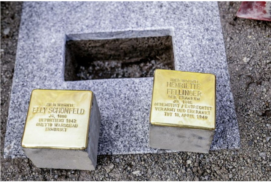
Die vom Künstler Gunter Demnig vorbereiteten Stolpersteine.