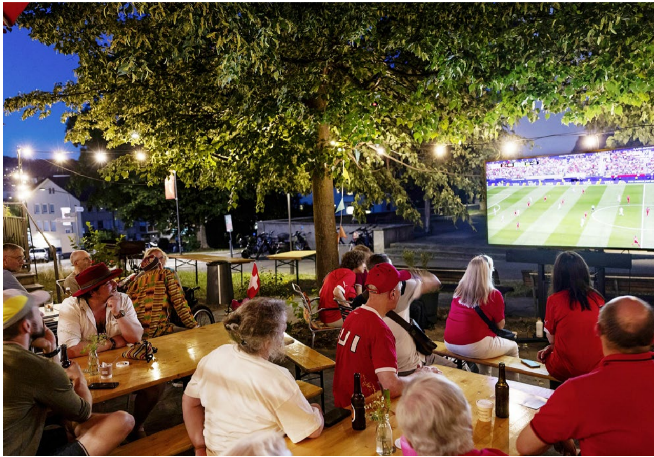
Das gemeinsame Fussballschauen unterm Blätterdach genossen insgesamt rund 50 Gäste.