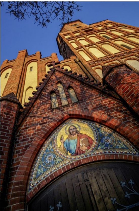
Die Spremberger Kreuzkirche.