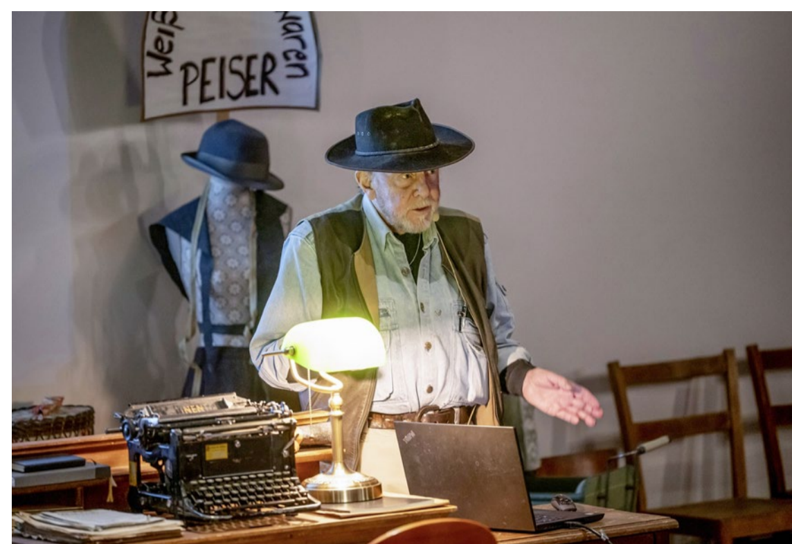
Hat mit den Stolpersteinen ein weltweites Projekt für Erinnerungsarbeit lanciert: Künstler Gunter Demnig.

Bischof Christian Stäblein über die Abgrenzung der Kirche gegen rechts: reformiert.info/afd