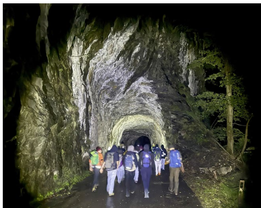
Im vergangenen Jahr nahmen 29 Jugendliche teil.