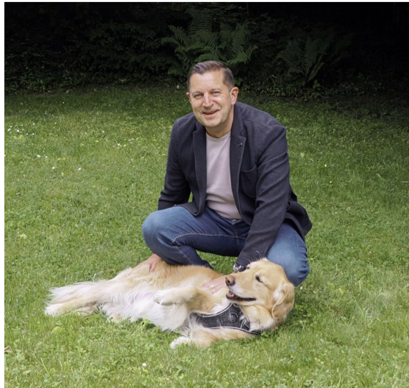
Die Podcasts mit Chris Strauch dauern rund eine halbe Stunde.

Monatlich im Auftrag der Landeskirche auch auf allen Streamingplattformen: gr-ref.ch/hallokirche