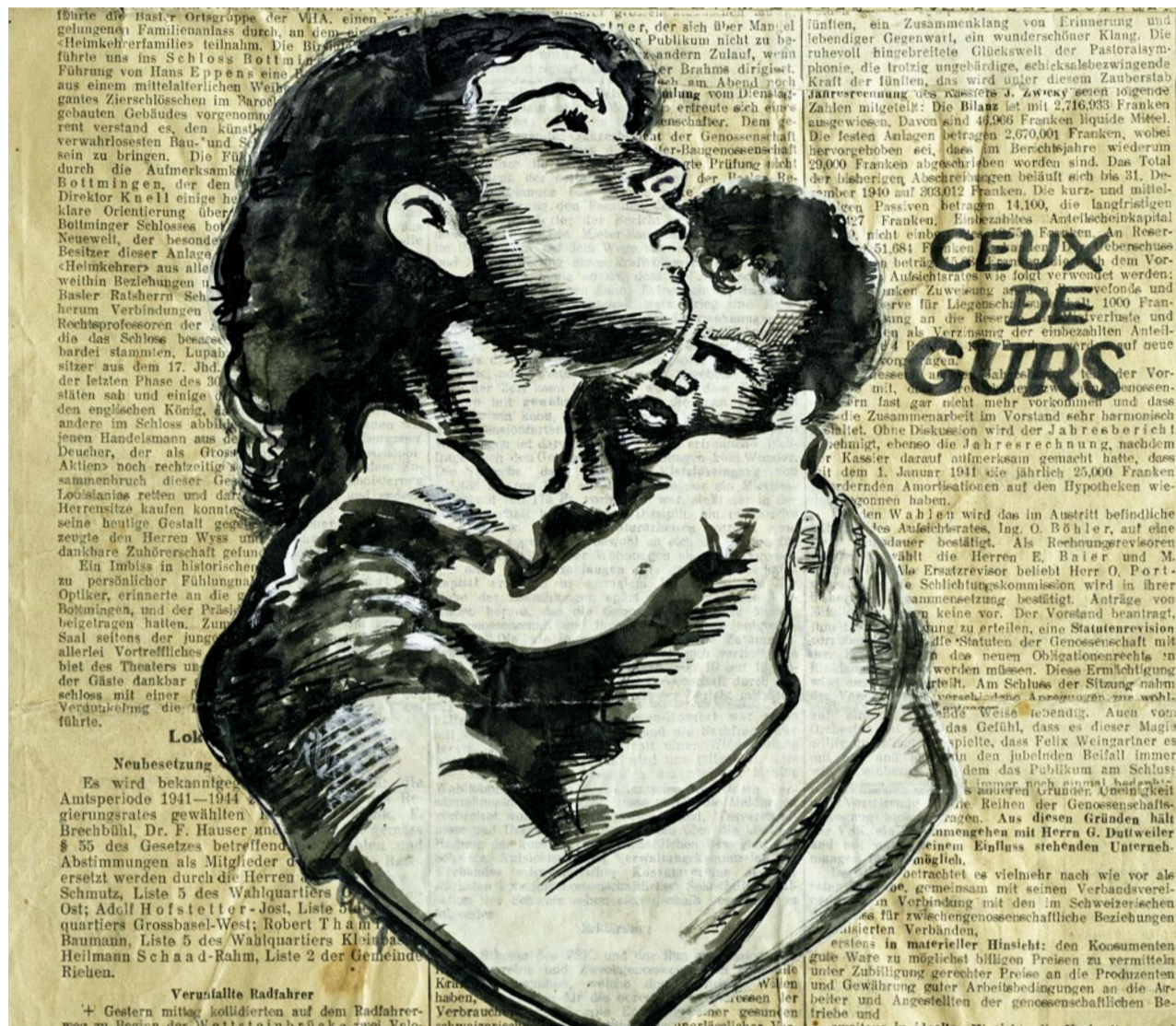
Kunst unter prekärsten Bedingungen: Ein Werk aus der Sammlung Elsbeth Kasser.

Davon zeugen Bilder, Zeichnungen und Postkarten, die Elsbeth Kasser grösstenteils von den Internierten geschenkt bekommen oder ihnen abgekauft hatte. Für den illegalen Transport in die Schweiz wusste sie