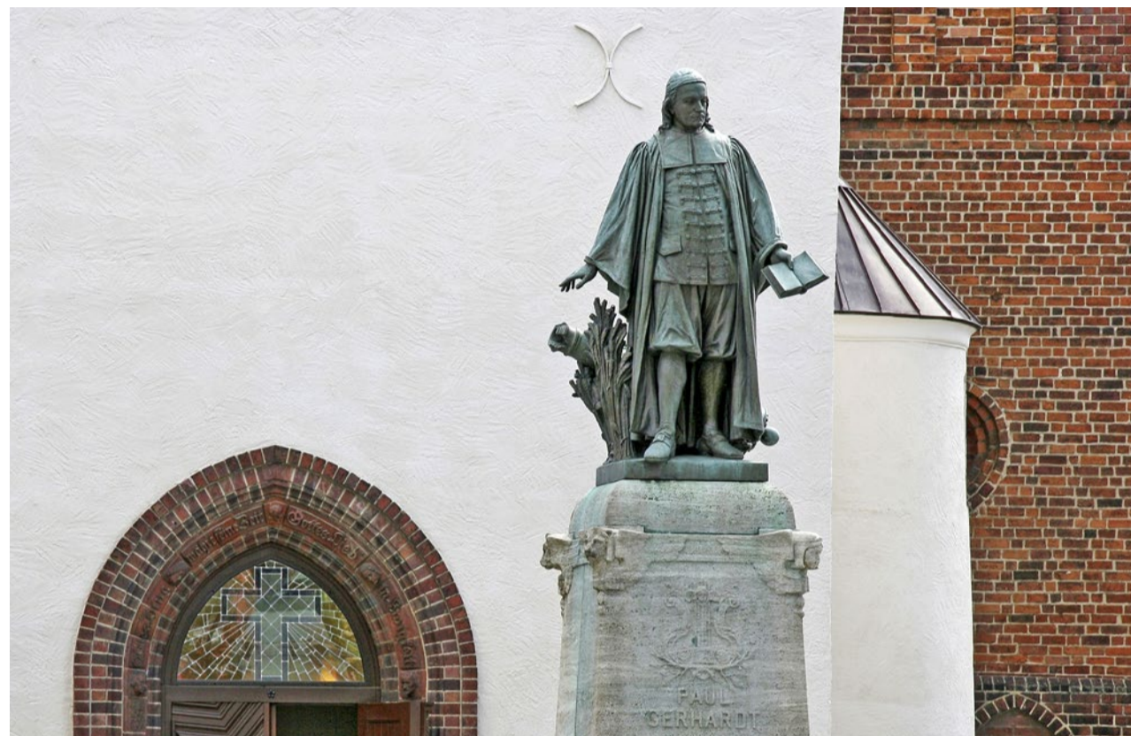
Die Lieder des Theologen Paul Gerhardt sind noch heute beliebt.

Als Kirchenlieddichter zeichnete Paul Gerhardt poetische Bilder, die zeigen, wie unermesslich grösser das Wunder des Lebens ist als alles, was der Mensch hervorbringt. Er schrieb über 130 Lieder: Trost- und Kreuzlieder, Abend- und Jahreszeitenlieder, geprägt von den frühen Erfahrungen von Gewalt, Tod und Krankheit während des Dreissigjährigen Kriegs. Was sie eint: Sie bleiben nie beim Leiden stehen, sondern münden stets in Hoffnung. «Befiehl du deine Wege» und «Nun ruhen alle Wälder» zählen zu den bekanntesten. Es sind Lieder von solcher Eingängigkeit, dass einige zu beliebten Volksliedern wurden. Ebenso wie das Lied, das mich als Schülerin so berührt hatte. In «Geh aus, mein Herz» klingt Gerhardts Haltung zur Schöpfung besonders