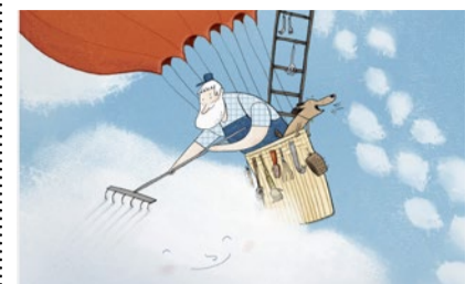
Wolkenkratzer bei der Arbeit.