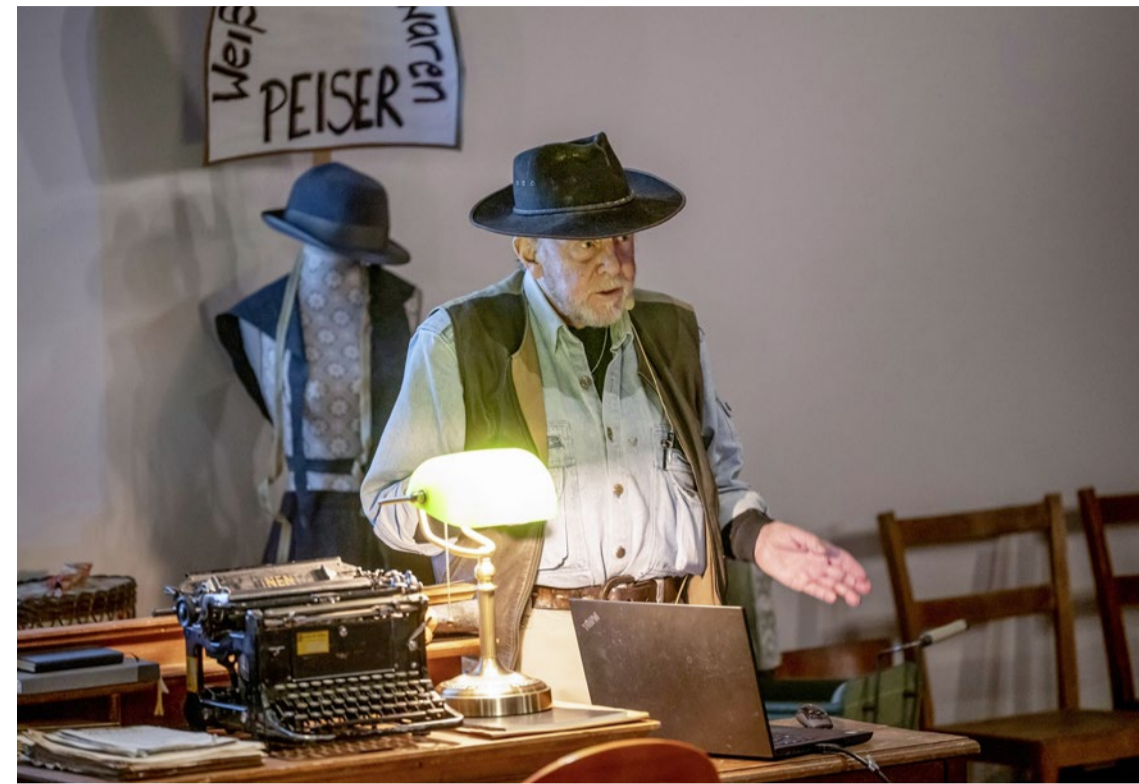
Hat mit den Stolpersteinen ein weltweites Projekt für Erinnerungsarbeit lanciert: Künstler Gunter Demnig.

Bischof Christian Stäblein über die Abgrenzung der Kirche gegen rechts: reformiert.info/afd