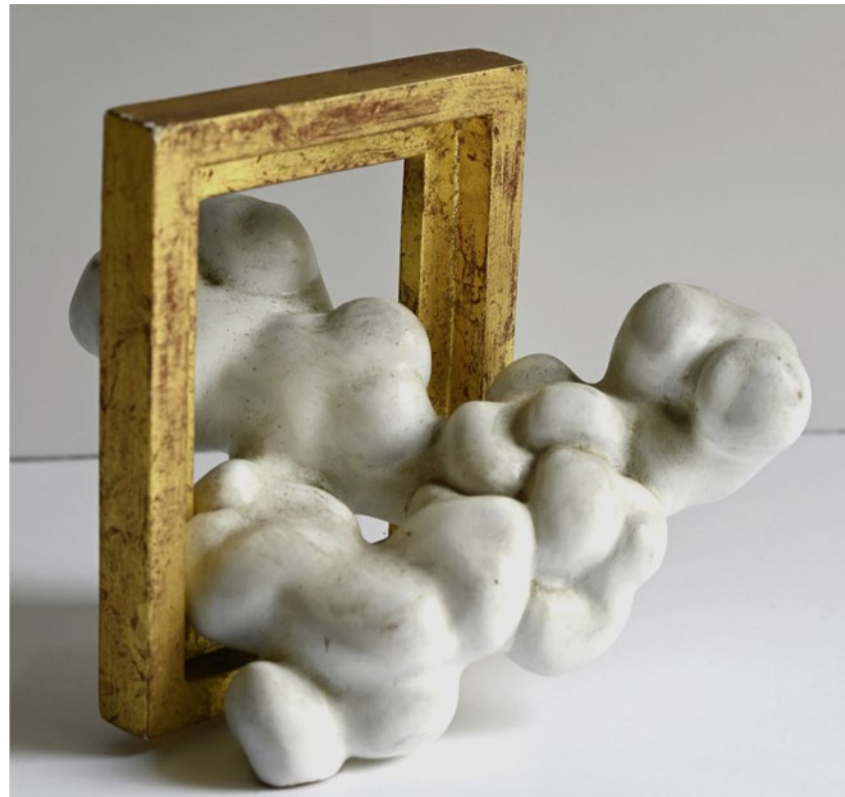
Bei Gillian White haben Wolken die Kraft, den Rahmen zu sprengen.

Gillian White: Wolken. Bis 1.11., Ikonenmuseum, Lenzburg, www.ikonenmuseum.ch