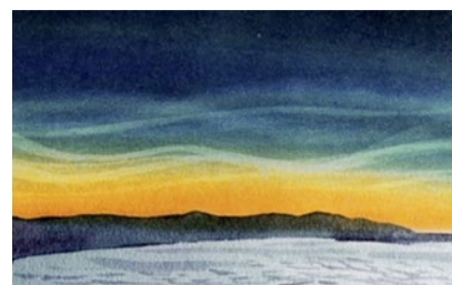
In den Wolken lesen.