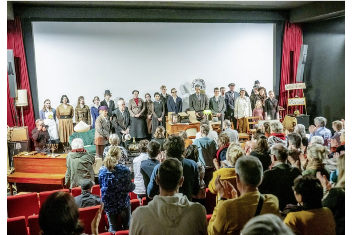
Standing Ovations im Kino Spremberg.