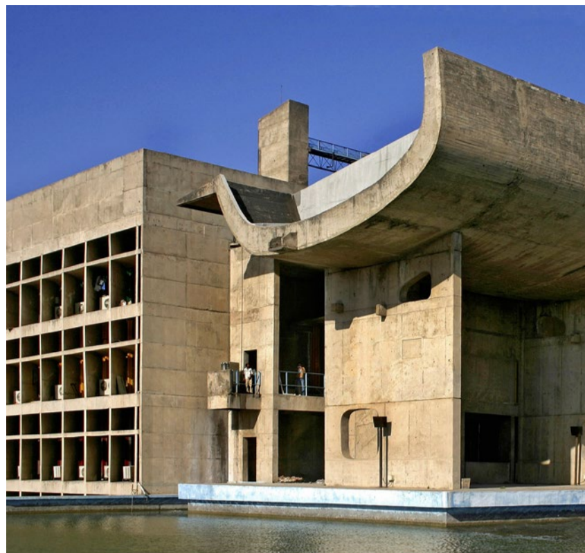
Le Corbusiers Parlamentsgebäude in Chandigarh.

Bauen für die Macht. Bis 26. November, Pavillon Le Corbusier, Zürich