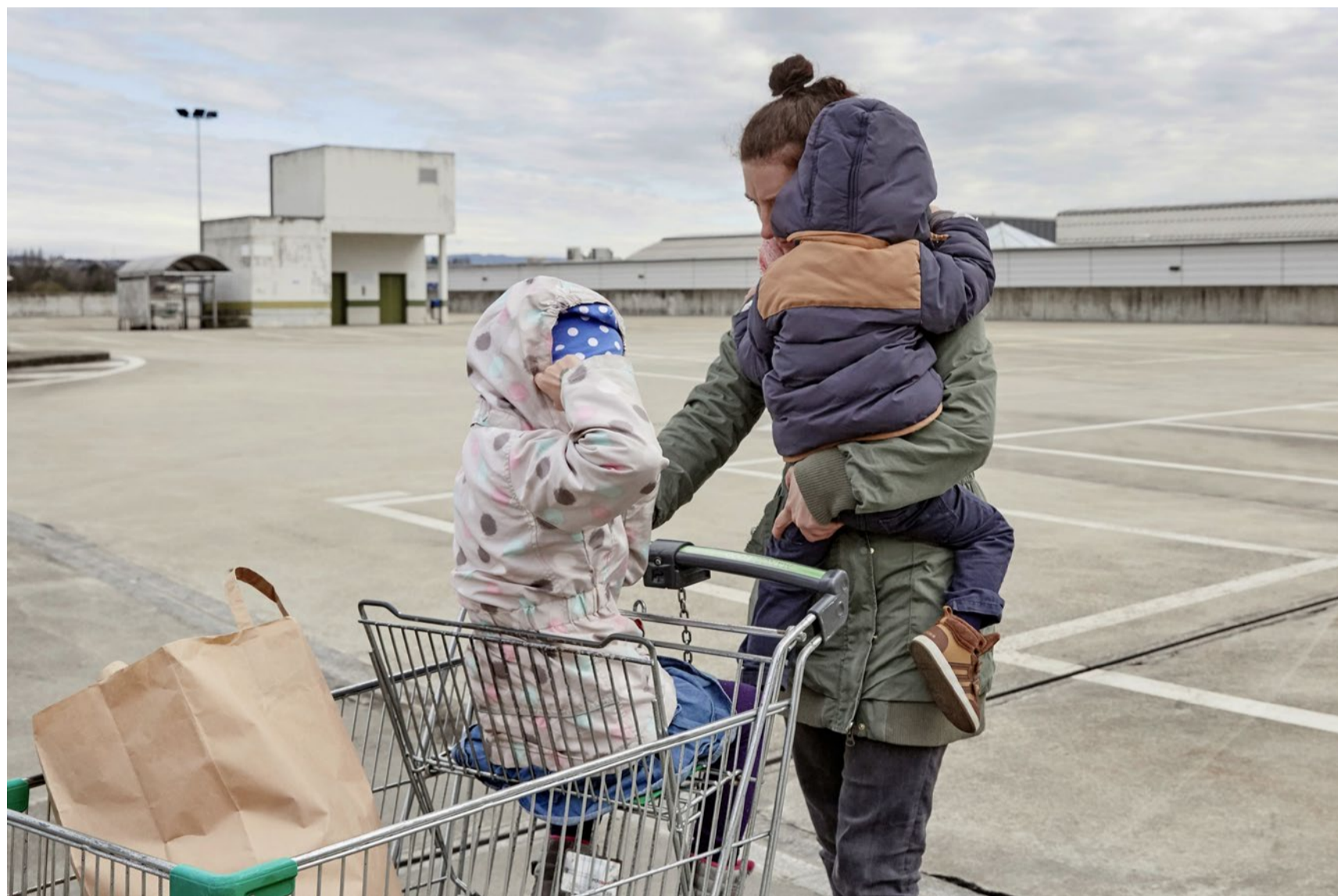
Allein erziehende Mütter und ihre Kinder leben besonders häufig unter dem Existenzminimum.

Politik Wer Armut selbst erlebt hat, soll von der Politik künftig besser gehört werden. Dafür wurde nun der Rat für Armutsfragen gegründet. Er setzt auf Wissen und Erfahrung der Betroffenen.