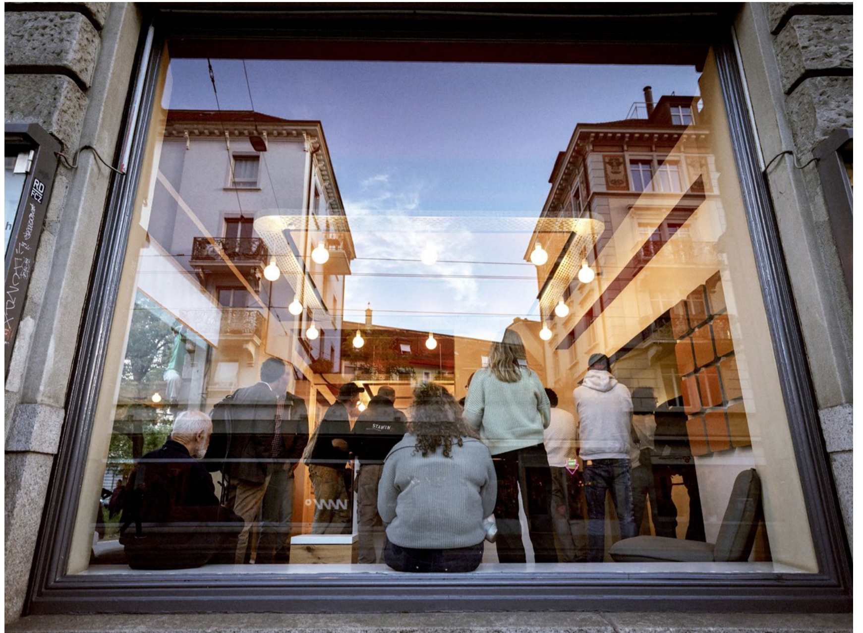
Der Blick durchs Fenster in die offene Atmosphäre der Streechurch Zürich im Kreis 4.

Spielzeug Hinter Reformator Martin Luther belegte sie den zweiten Platz in der Hitparade der beliebtesten Playmobil-Figuren. Nun lanciert der Spielzeughersteller eine neue Edition der Schwarzwald-Marie. Sie trägt die Tracht mit dem berühmten Bollenhut, den die evangelischen Frauen einst im katholisch geprägten Schwarzwald aufhatten. Allerdings wechselt die Hutfarbe von Rot auf Schwarz, weil Marie geheiratet hat. Und zwar den Schwarzwald-Hannes, der ihr im Set für Sammler zur Seite steht. fmr