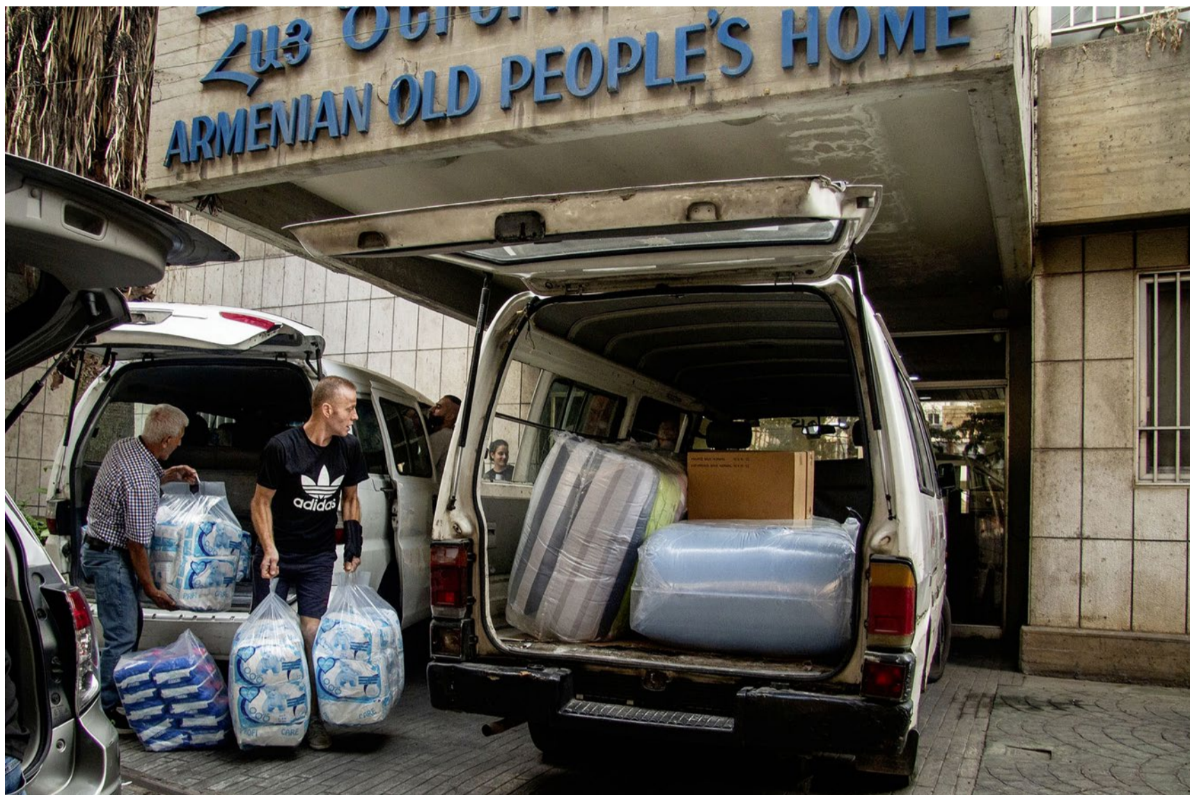
Nothilfe in Beirut: Freiwillige einer armenischen Kirchgemeinde versorgen mit Unterstützung des Heks Bedürftige mit Lebensmittel.

Synode Eine Motion in der Zürcher Kirchensynode will die Unterstützung für das Heks auf die Nothilfe beschränken. Die Umsetzung hätte einschneidende Folgen für das kirchliche Hilfswerk.