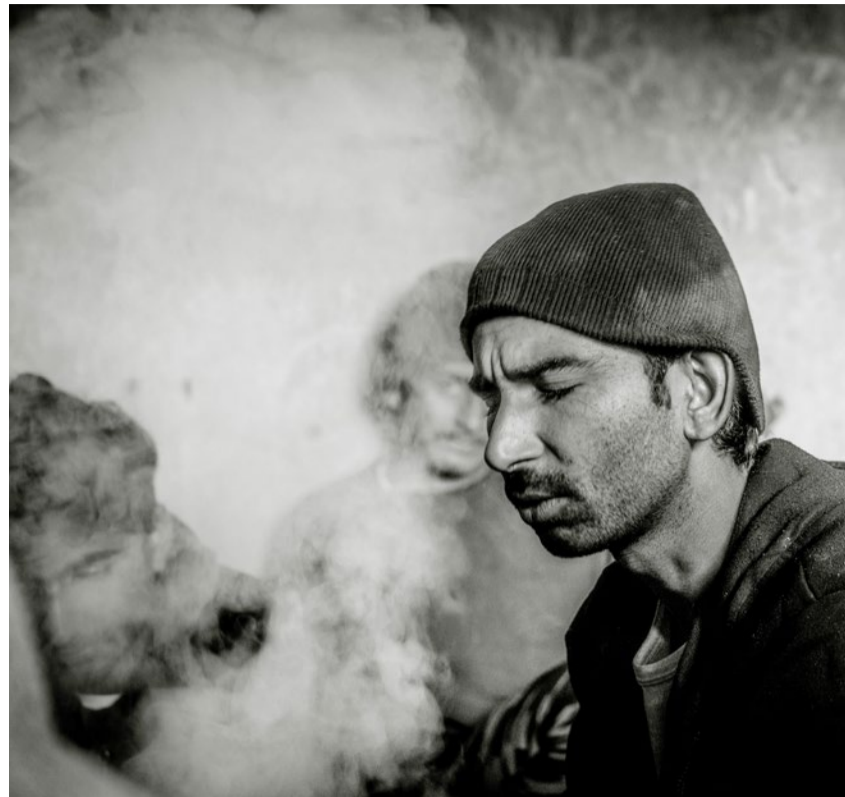
Menschen auf der Flucht in differenzierten Grautönen.

Spuren der Flucht. 21. Juni bis 3. Juli, Stadtkirche Biel, www.ref-biel.ch