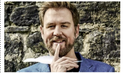
Autor Benedikt Meyer.