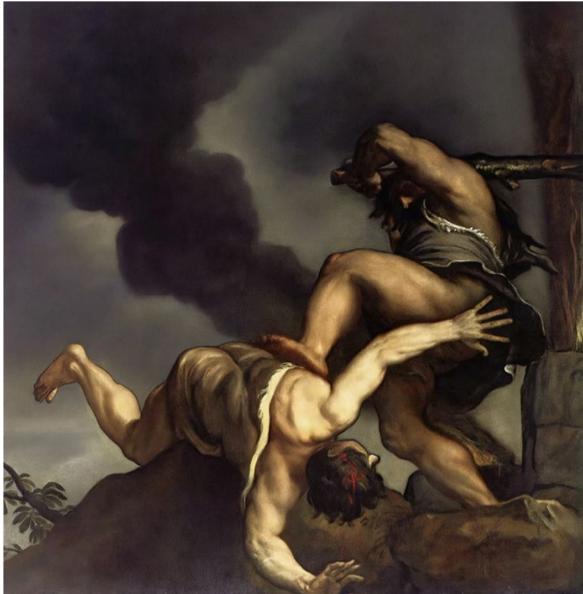
Wenn sich einer über den anderen erhebt: Kain und Abel. Gemälde: Tizian