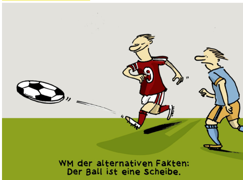
WM der alternativen Fakten: Der Ball ist eine Scheibe.