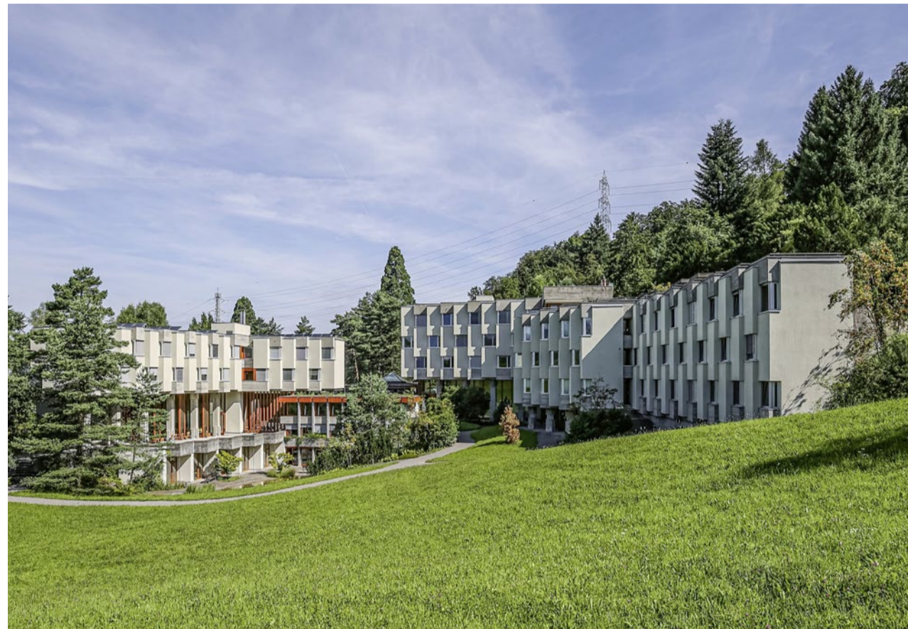
Malerisch gelegen oberhalb von Zug: Das Lassalle-Haus in Bad Schönbrunn.

Bildung Vor einem Jahr schloss das spirituelle Zentrum der Jesuiten in Bad Schönbrunn für Übernachtungsgäste. Nun ist klar: Alle Rettungsversuche sind gescheitert, der Orden sucht einen Käufer für die Immobilie.