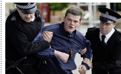
Davidson (R. Aramayo).