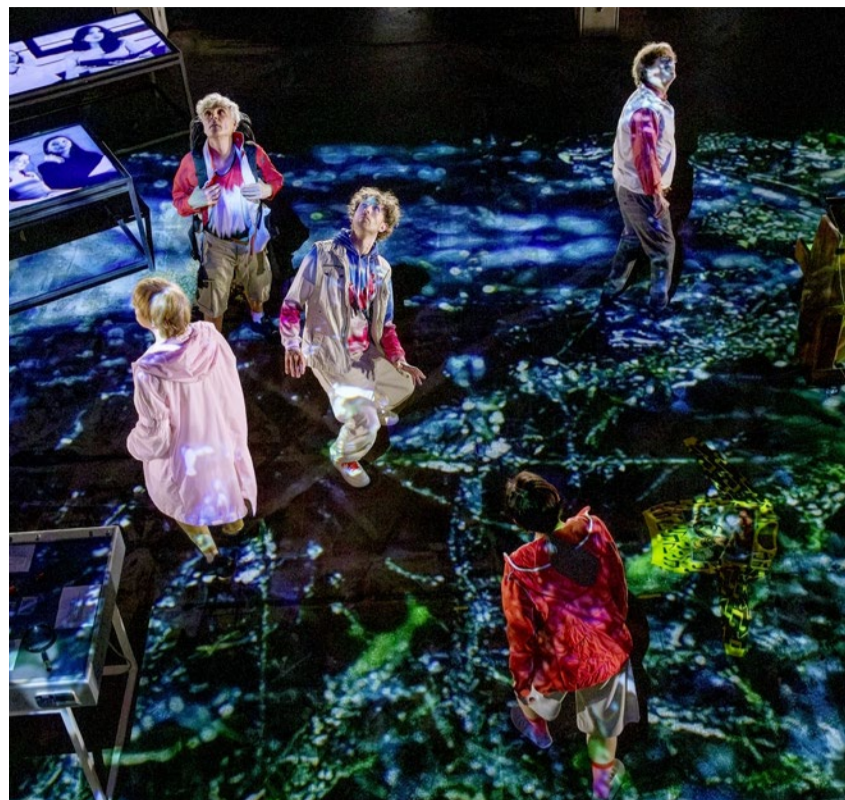
Auf das Publikum wartet ein begehbare Inszenierung.

No Name (God). 12. bis 14. Juni, ab 19 Uhr, Citykirche Offener St. Jakob, Zürich