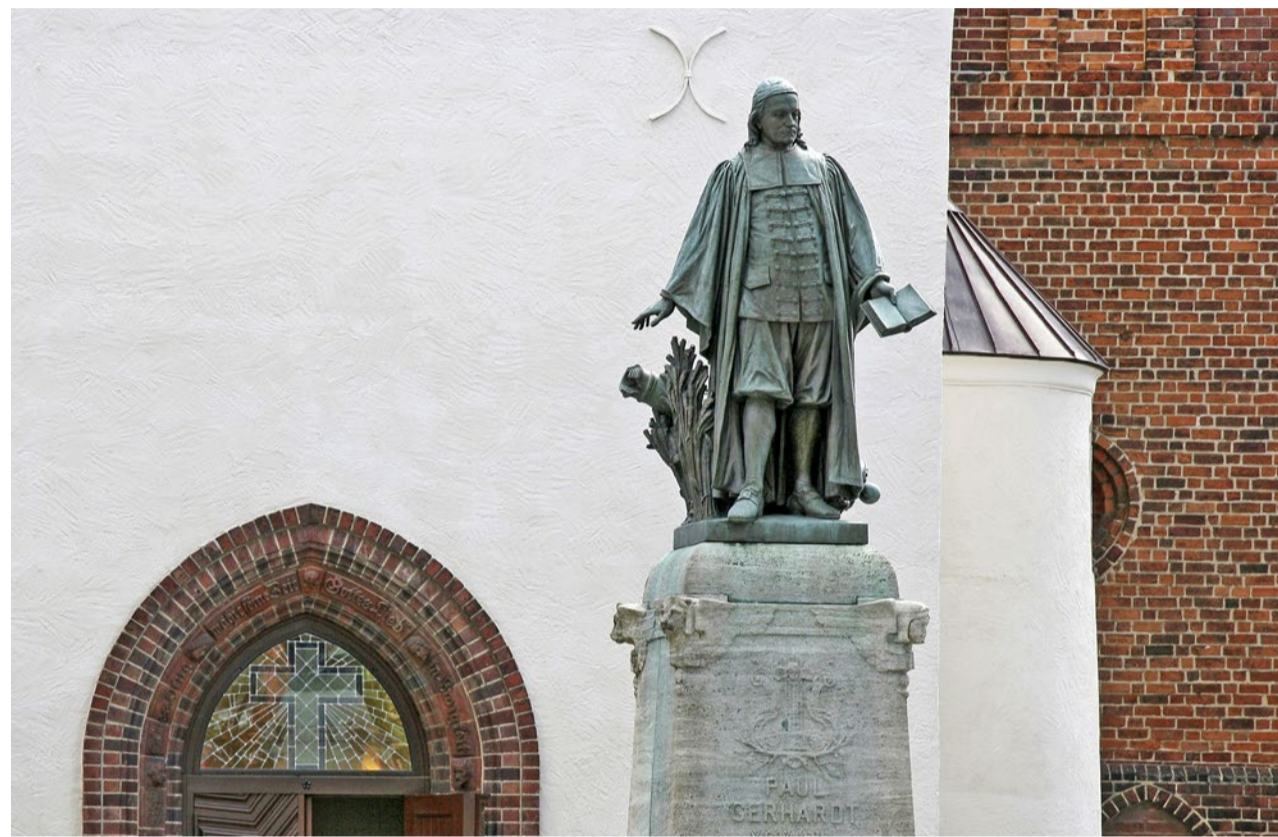
Die Lieder des Theologen Paul Gerhardt sind noch heute beliebt.

Als Kirchenlieddichter zeichnete Paul Gerhardt poetische Bilder, die zeigen, wie unermesslich grösser das Wunder des Lebens ist als alles, was der Mensch hervorbringt. Er schrieb über 130 Lieder: Trost- und Kreuzlieder, Abend- und Jahreszeitenlieder, geprägt von den frühen Erfahrungen von Gewalt, Tod und Krankheit während des Dreissigjährigen Kriegs. Was sie eint: Sie bleiben nie beim Leiden stehen, sondern münden stets in Hoffnung. «Befiehl du deine Wege» und «Nun ruhen alle Wälder» zählen zu den bekanntesten. Es sind Lieder von solcher Eingängigkeit, dass einige zu beliebten Volksliedern wurden. Ebenso wie das Lied, das mich als Schülerin so berührt hatte. In «Geh aus, mein Herz» klingt Gerhardts Haltung zur Schöpfung besonders