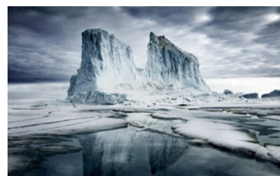
Exponat in Olten.