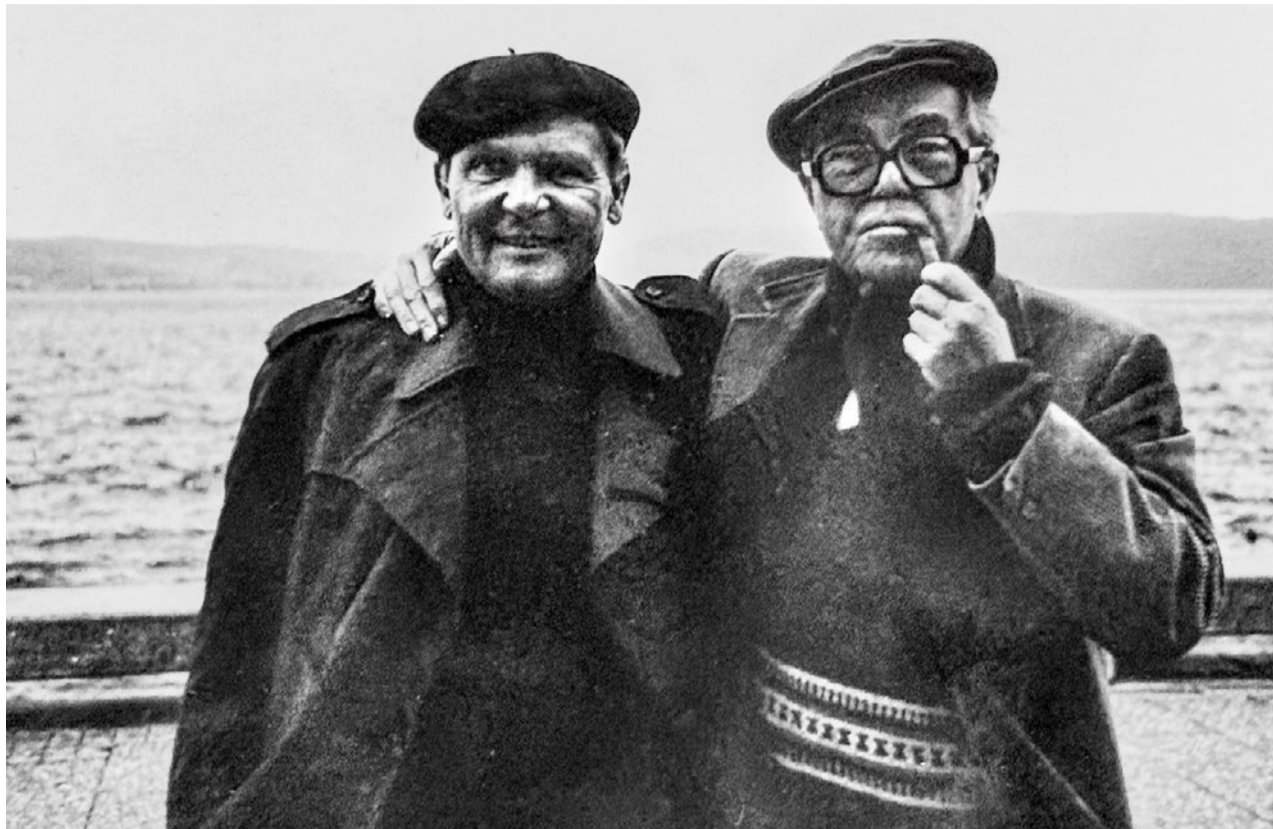
Der Strafrechtler und Publizist Peter Noll (links) mit dem Schriftsteller Max Frisch.

Palliativpflege und Sterbehilfe waren zu jener Zeit noch keine breit diskutierten und gesellschaftlich etablierten Themenfelder. Die Sterbehilfe-Organisationen Exit – ein Verein für die Westschweiz sowie ein weiterer für die Deutschschweiz – wurden im Jahr 1982 gegründet, lediglich ein paar Monate vor Nolls Ableben. Dieser nimmt in seinen Diktaten wohlwollend, jedoch kurz und sachlich Stellung: «Neuestens gibt es eine Vereinigung «Exit», die sehr vernünftige Aufklärung betreibt, letztlich auch für den «Freitod». Vor allem aber geht es darum,