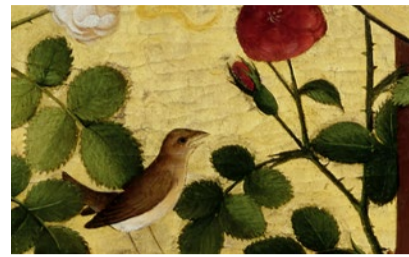
Frauenkarriere im Mittelalter.