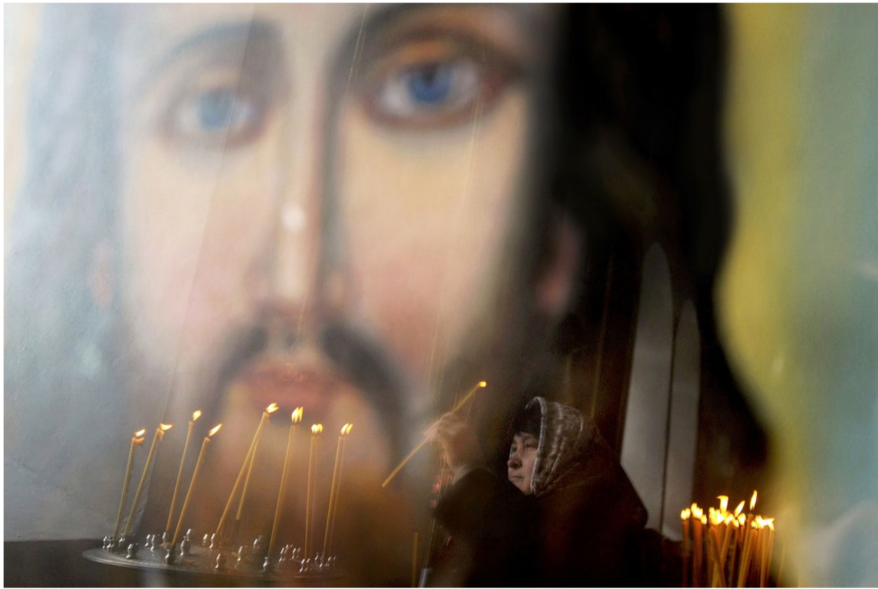
Stiller Akt in der Kirche: Eine Belarussin zündet ein Licht der Hoffnung an.

Politik Belarus wird an der Seite Russlands zur Kriegspartei. Doch die Opposition vernetzt sich, wie schon im Herbst 2020. Nur diesmal leise und kaum sichtbar, mit der Hoffnung auf Frieden.