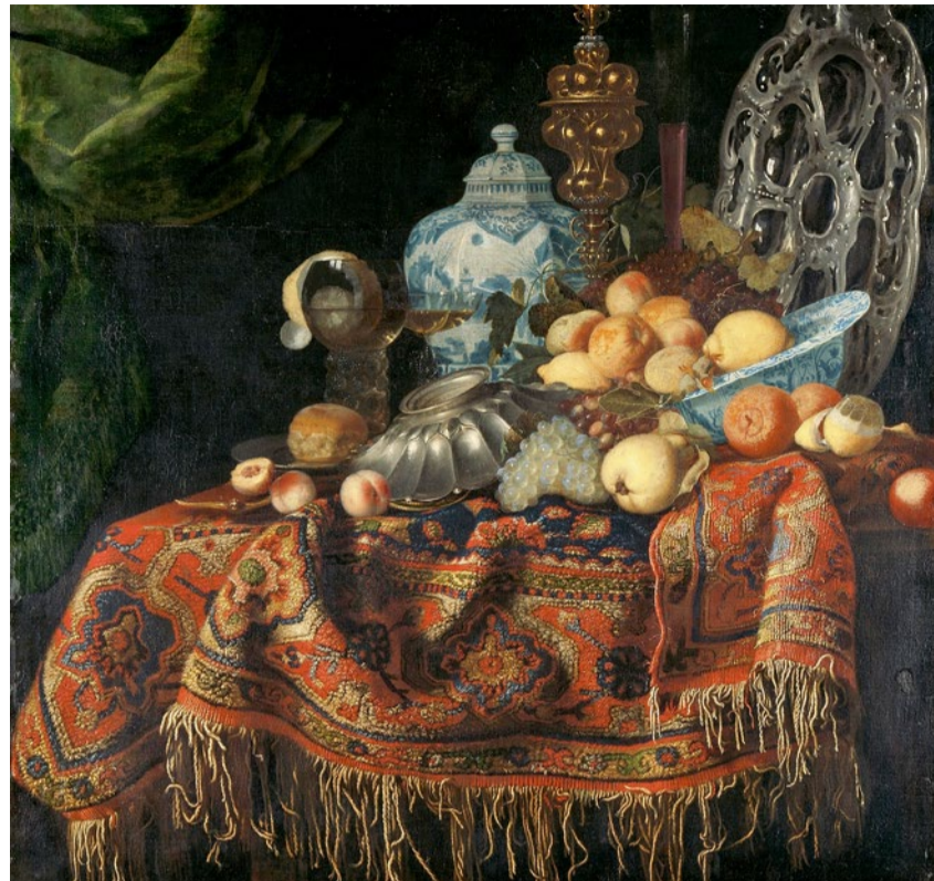
Stilleben, Simon Luttichuys zugeschrieben.

Barock, Zeitalter der Kontraste. Bis 15. Januar, Landesmuseum, Zürich