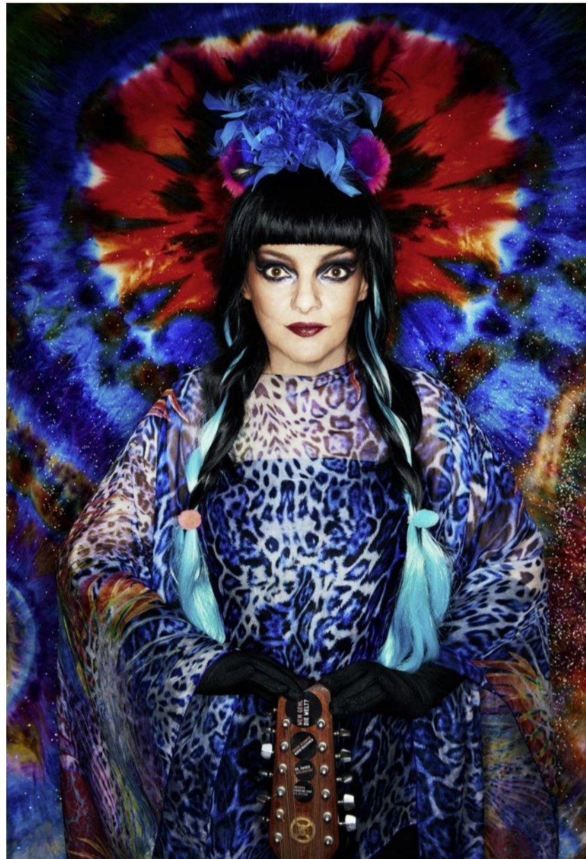
Eine Kunstfigur und doch ganz bei sich: Nina Hagen.

Ins Zentrum ihrer Musik stellt Hagen ihren Glauben und damit die Botschaft: Gott und Liebe. In einem Interview mit dem Magazin «Christmon» erzählte sie einmal, wie sie als Jugendliche auf der Suche nach einer Gotteserfahrung LSD einwarf. Sie sei an einem Ort gelandet, an dem es kein Leben und keinen Tod gegeben habe, nur Schmerzen. «Oh, mein Gott, hilf mir doch!», habe sie gerufen und sei plötzlich in eine tiefe Ruhe gekommen. «Gott hat mich mit einer Liebe angeschaut, die kann