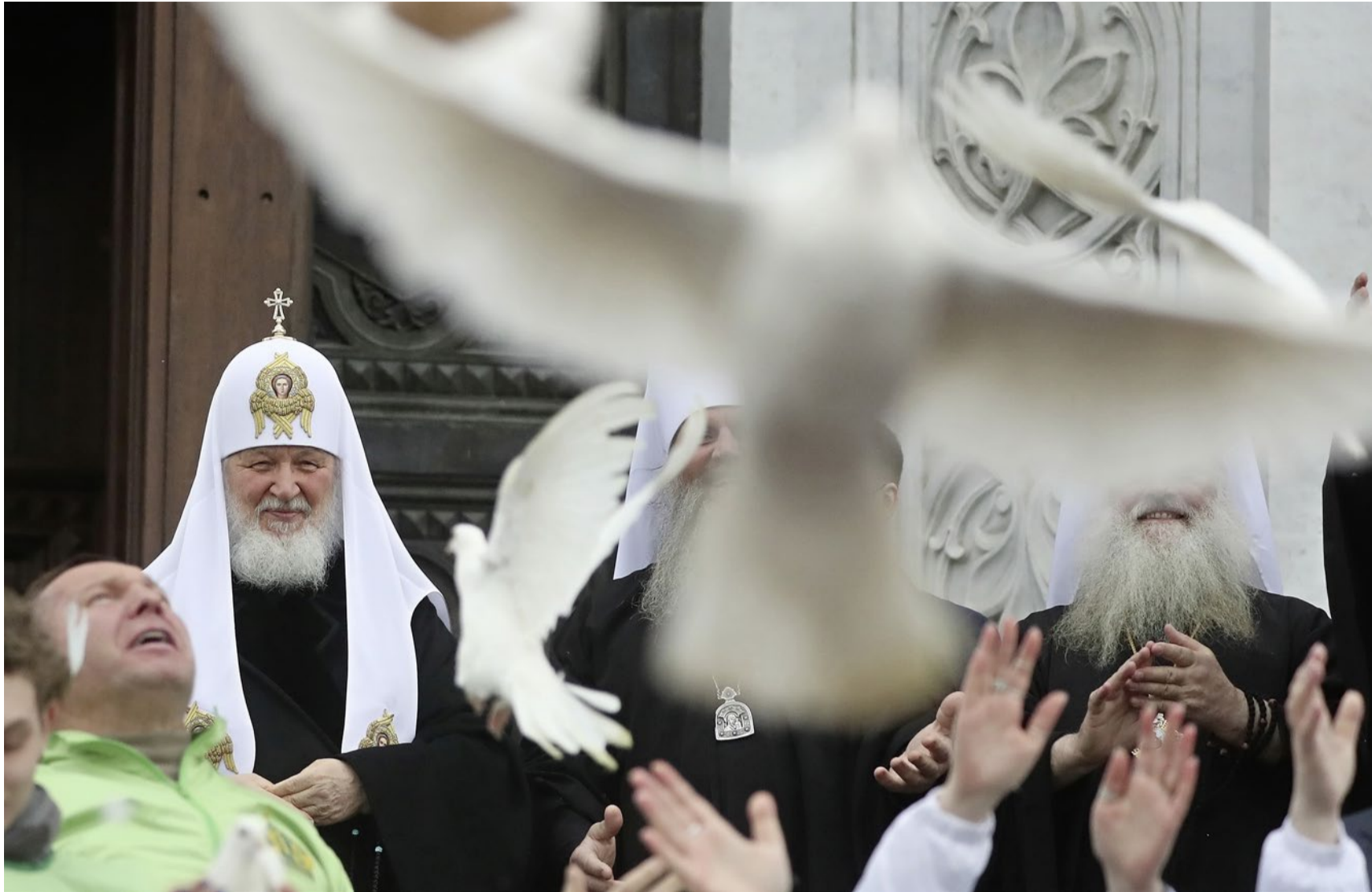
Alles andere als ein Friedensstifter: Patriarch Kyrill, Oberhaupt der Russisch-Orthodoxen Kirche, unterstützt Putins Angriffskrieg.