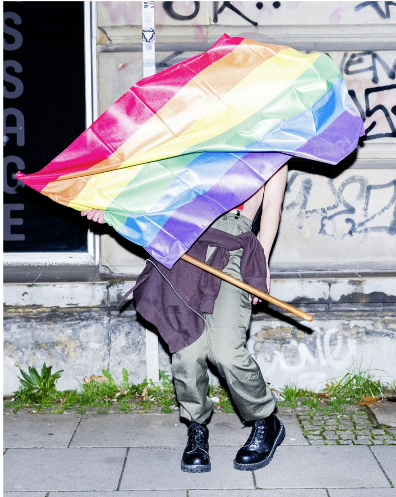
Queere Solidarität: Trotz Pandemie wurde im November 2020 in Warschau für Frauenrechte demonstriert.

Gender In Zürich haben sich christliche LGBT-Organisationen aus ganz Europa getroffen. Zwei Teilnehmende aus Polen und Estland berichten im Gespräch von Hass und Repression, aber auch von Liebe und Hoffnung.