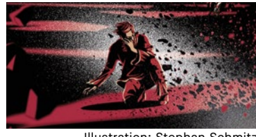
Illustration: Stephan Schmitz

Kinder und der Krieg Wie mit Kindern über den Krieg gesprochen werden sollte und warum das Gebet helfen kann. REGION 2