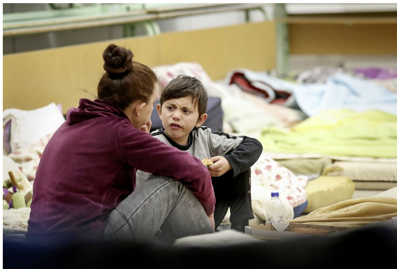
Frauen und Kinder auf der Flucht: Bilder wie dieses aus Ungarn beschäftigen Kinder auch hierzulande.

Fernsehen Nachdem die Pandemie mehrmals die RTL-Version der Passionsgeschichte verhindert hatte, will der private Sender sein Bibel-spektakel am 13. April senden. Als Erzähler wurde Thomas Gottschalk verpflichtet. «Sich an die Jüngerinnen zu gewöhnen», die mitspielen, bezeichnet er als seine grösste Herausforderung. Das müsste zu schaffen sein. Jesus hat es vor gut 2000 Jahren ja auch hinbekommen, und Paulus persönlich lässt Apostelin Junia grüssen, die noch vor ihm zu Christus gehört habe (Röm 16,7). fmr