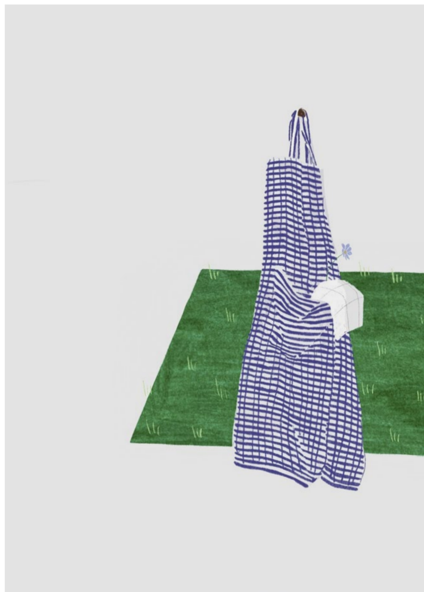
«Grossmutter trug immer Schürzen.»

17 Persönlichkeiten – ein ehemaliger Bundesrat, Schriftsteller, Theologinnen, eine Schauspielerin und auch «reformiert»-Redaktionsleiter Felix Reich – stellten sich der Aufgabe. Alle mit dem Anspruch, das Thema unsentimental, wahrhaftig und zeitgemäss darzustellen. Das führte dazu, dass der Titel «Eiertanz» in seinem doppeldeutigen Sinn zum Zug kommt – so wie