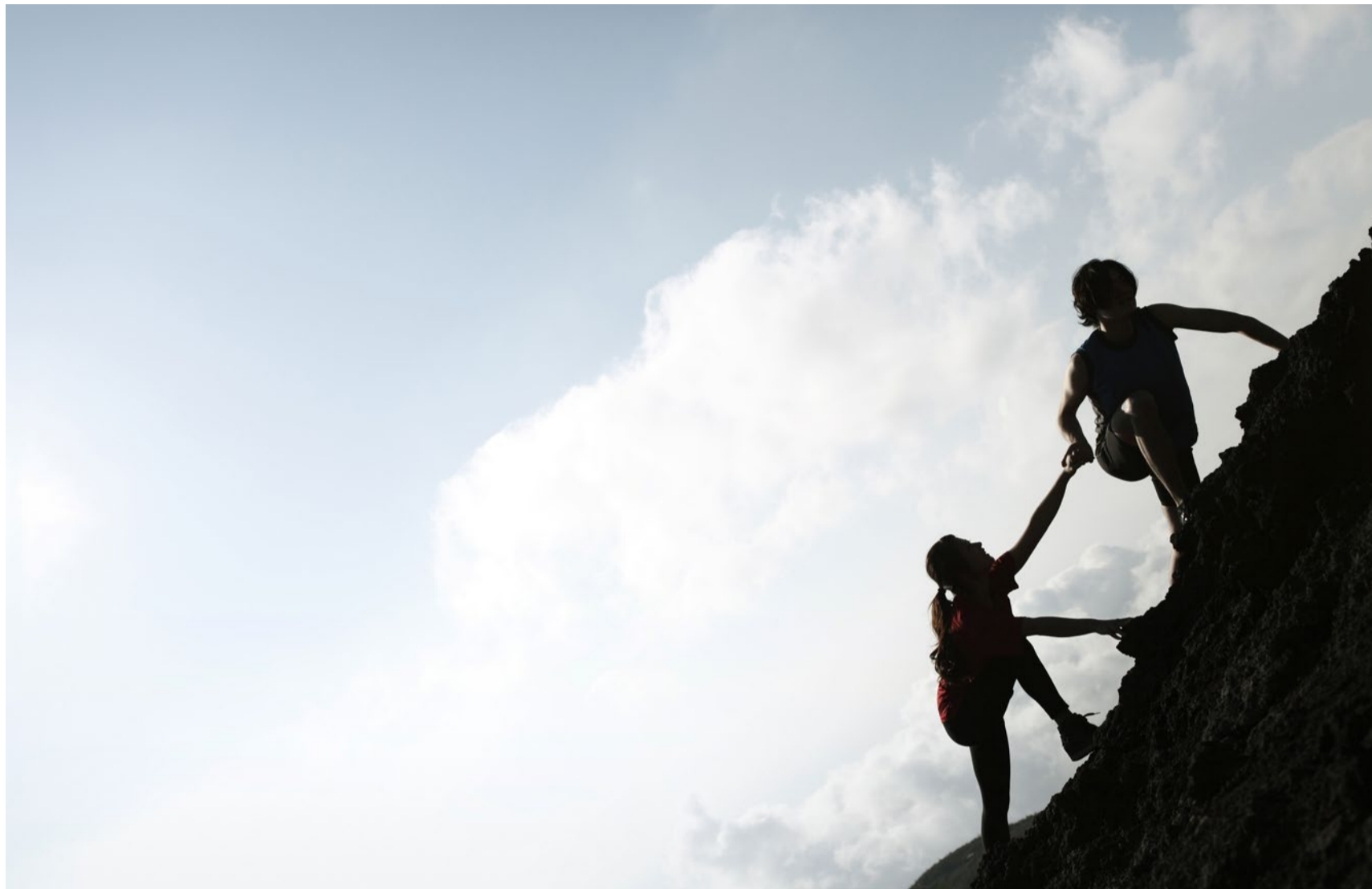
Verena Kast, die Grande Dame der Jung'schen Psychologie, sagt: Einander zu vertrauen, ist ein Risiko, das sich lohnt.

Psychologie Vertrauen ist ein essenzielles Lebenselixier. Verena Kast hat in der Pandemie ein Buch über die aktuelle Vertrauenskrise geschrieben und zeigt Rezepte auf, wie wir wieder herausfinden.