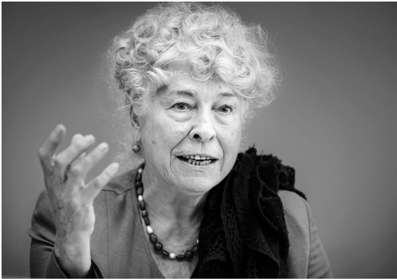
Humanität ist möglich: Politikwissenschaftlerin Gesine Schwan.