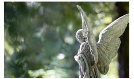
Neustart mit dem Engel.