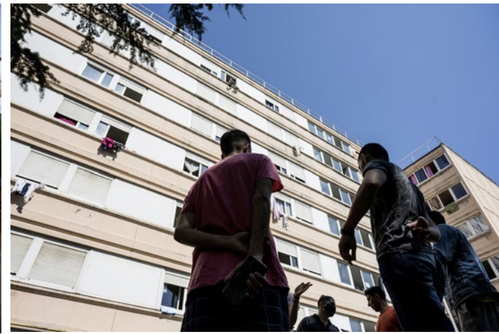
Ein Zuhause für wenige: Wer es in die Unterkunft für Sans-Papiers am Rand von Lyon geschafft hat, ist einen Schritt weiter. Viele Asylsuchende enden auf der Strasse.