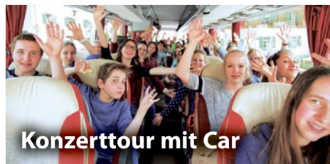
Konzerttour mit Car