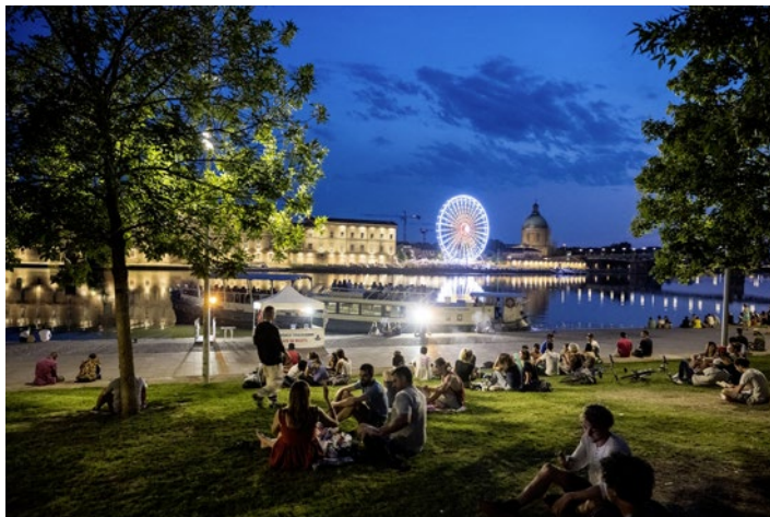
Schlafplatz für eine Nacht: Während ganz Toulouse die lauen Sommernächte am Fluss Garonne genießt, richtet sich Christian unter freiem Himmel zum Schlafen ein.