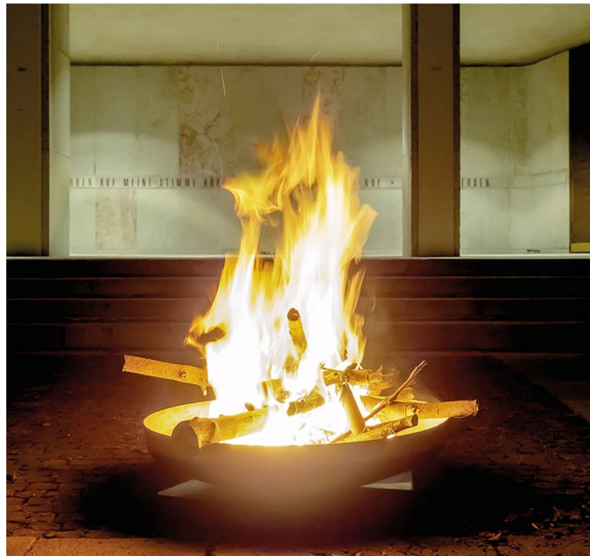
Vor zehn Jahren loderte die Idee für ein Stadtkloster auf.