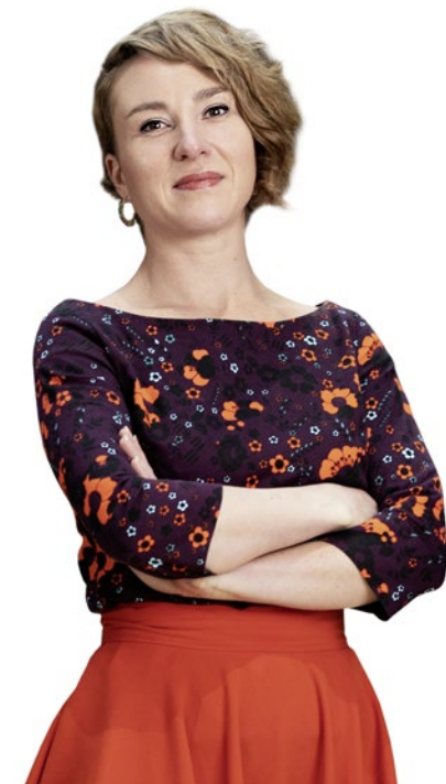
Die 34-jährige Grünen-Politikerin und Religionswissenschaftlerin präsidiert den Nationalrat.