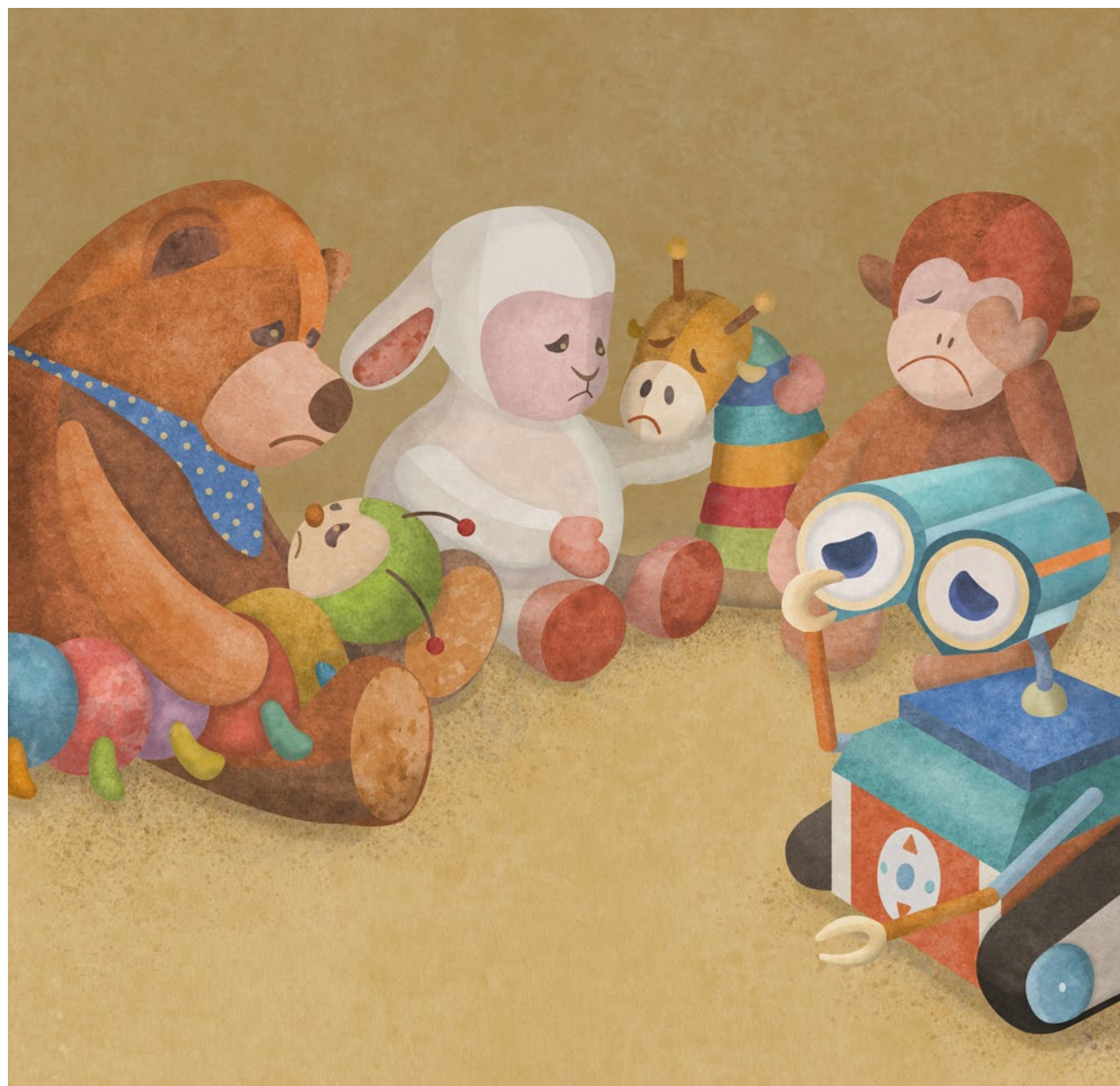
Illustration: Juliana Aschwanden-Vilaça

Politik Neben Kanzler Olaf Scholz (SPD) legten 7 der 17 Kabinettsmitglieder der deutschen Regierung ihren Amtseid ohne Verweis auf Gott ab. Im schwarz-roten Kabinett von Angela Merkel (CDU) hatten 13 von 16 Mitgliedern um die Hilfe Gottes gebeten. Alle Ministerinnen und Minister der Grünen verzichteten nun laut der Agentur EPD auf religiöse Bezüge. Der Finanzminister Christian Lindner (FDP) hingegen, der aus der katholischen Kirche ausgetreten ist, schwor mit dem Zusatz: «So wahr mir Gott helfe». fmr