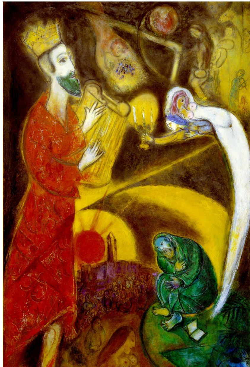
Marc Chagall: Le Roi David (1950/51).

Die Klagelieder in den Psalmen richten sich entweder als «Feindklage» gegen den Verursacher des Leids oder gegen Gott selbst, der es zugelassen hat («Gottklage»), oder auch gegen den Klagenden selbst («Ich-Klage»). «In den Psalmen be-