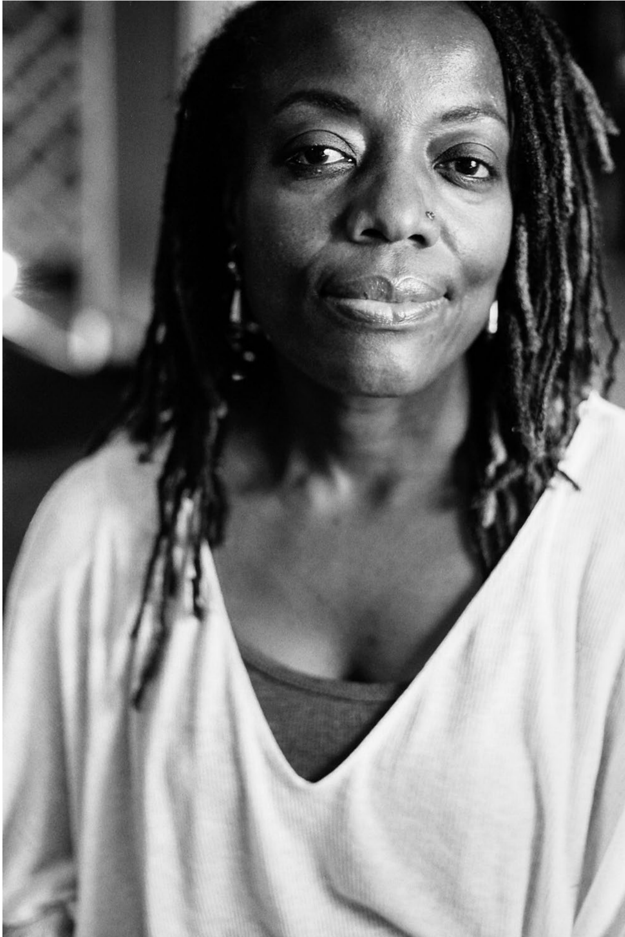
Tsitsi Dangarembga ist eine der wichtigsten und populärsten Künstlerinnen Simbabwe.