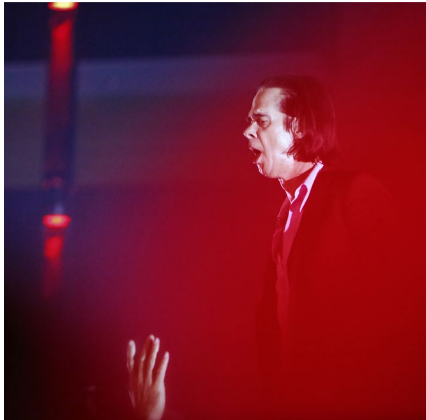
Als die Bühne noch sein Balkon war: Nick Cave in Athen.

Ellis spürt, was die assoziativen, atmosphärisch dichten, immer in die Offenheit der Interpretation weisen Texte des Freundes brauchen. Einmal kontrastiert er einen mändrierenden Klagepsalm mit pulsierender Elektronik («Hand of God»),