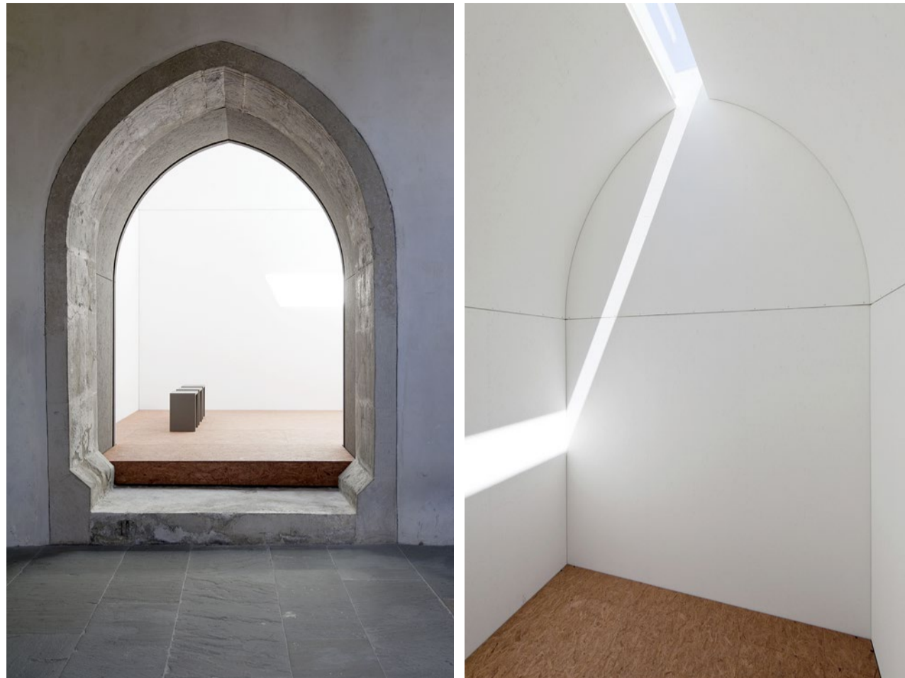
Baulicher Durchbruch in eine neue Form von Kirche, wo Kunst und Spiritualität sich treffen.

Bibel Eine Arche haben sie schon in Williamstown, Kentucky. Nun wollen die Kreationisten ihren Themenpark Ark Encounter mit dem Turm zu Babel erweitern. In der Bibel illustriert der Turm die Hybris der Menschen, die buchstäblich zu hoch hinaus wollen. Gott stoppte sie, indem er «die Sprache aller Bewohner der Erde verwirrte» (1. Mose 11,9). Babel blieb eine Baustelle der Missverständnisse. Daher wäre im biblischen Bibelpark eigentlich eher eine Performance angesagt als ein eindrücklich hoher Turm. fmr