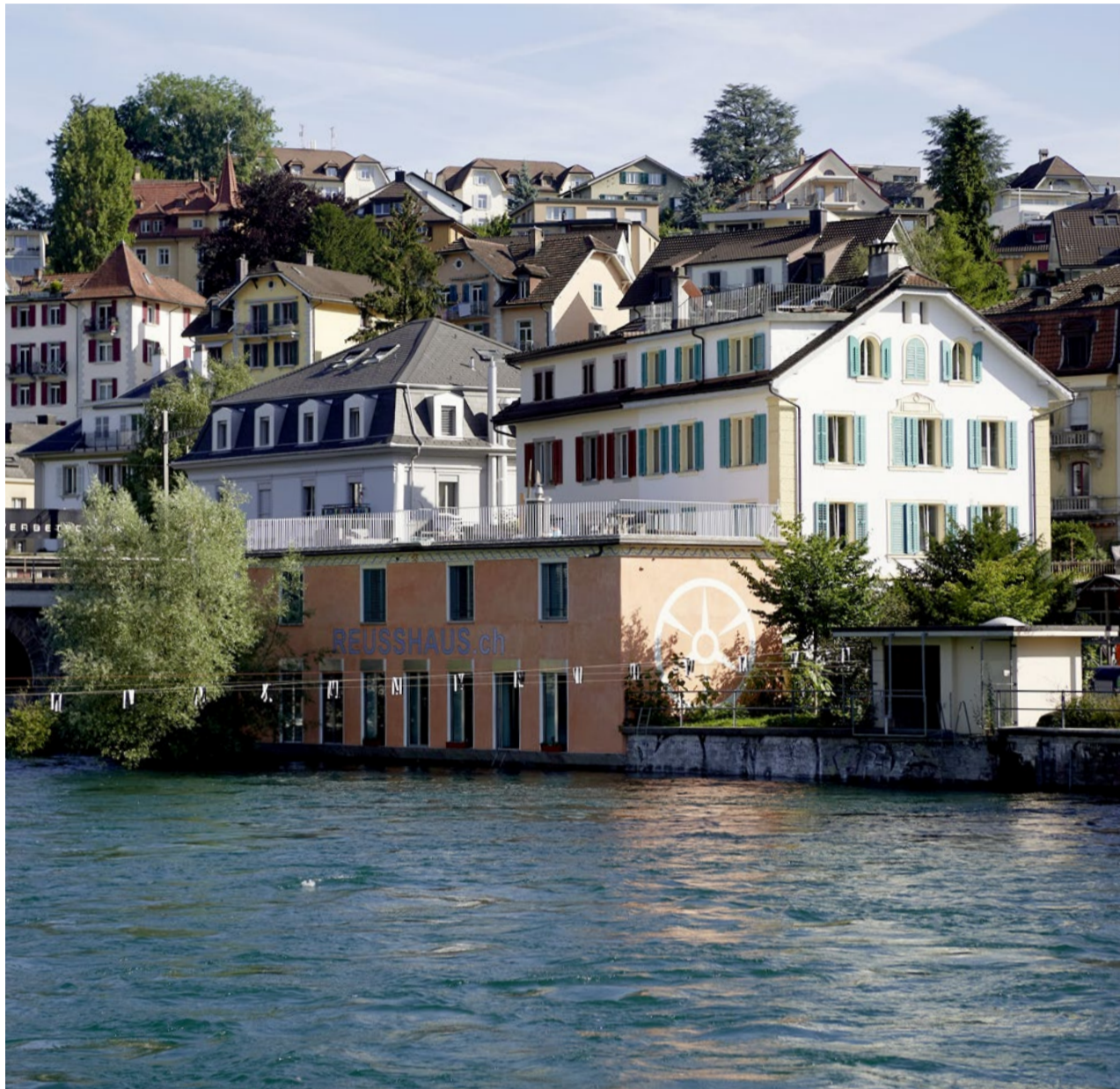
Vieles ist noch im Fluss: Das ökumenisch ausgerichtete Institut Reusshaus in Luzern.