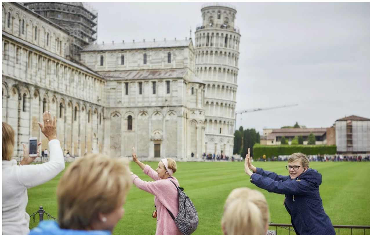
Wird alles wieder wie früher, oder bleibt die neue Realität scheps? Touristinnen in Pisa.

Dass es schwierig wird, nun wieder zur Normalität zurückzukehren, glaubt Wilhelm Schmid nicht. «Wir tun es einfach», sagt er. So geht der Philosoph wieder ins Café. Doch dorthin nimmt er das Wissen mit,