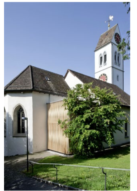
Veltheims Temporäre Kapelle.

Auch skeptische Mitglieder der Kirchgemeinde hätten mit der Zeit Freude am Projekt bekommen, sagt Bättig. «Die einen freuten sich mehr an der Kapelle selbst, die anderen an der Kunst.» Zudem sei ein Stück offene Kirche entstanden: «Jemand hat den Raum regelmässig für sein Krafttraining genutzt, und eine Cellospielerin kommt zum Üben.» Die nächste Ausstellung ist für September geplant. Christian Kaiser