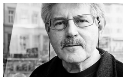
Autor Josef Imbach.