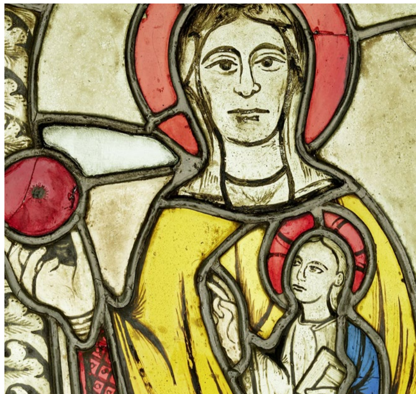
Um 1200 erschaffenes Chorfenster: Die Flumser Madonna.

Farben im Licht. Bis 3. April 2022, Landesmuseum Zürich, www.landmuseum.ch