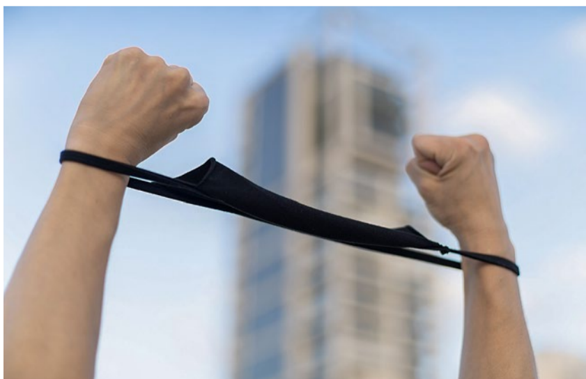
Maskengegner verharmlosen immer wieder das NS-Regime.

Antisemitismus Verschwörungstheorien und banalisierende Holocaust-Vergleiche haben bei den Leugnern des Coronavirus Hochkonjunktur.