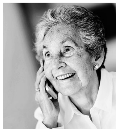
Gratis und anonym.