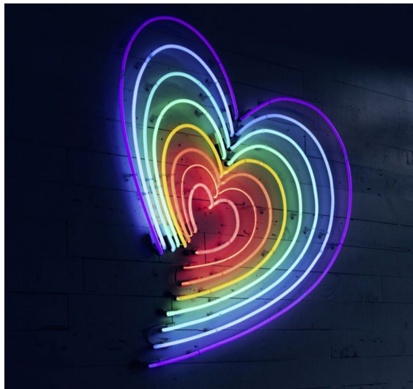
Ein Regenbogen, ein Herz, zwei Menschen: Homo-Liebe leben.

Braunschweig, Noth, Tanner, (Hg.): Gleichgeschlechtliche Liebe und die Kirchen. Verlag TVZ, 2021, 188 Seiten, Fr. 29.80.