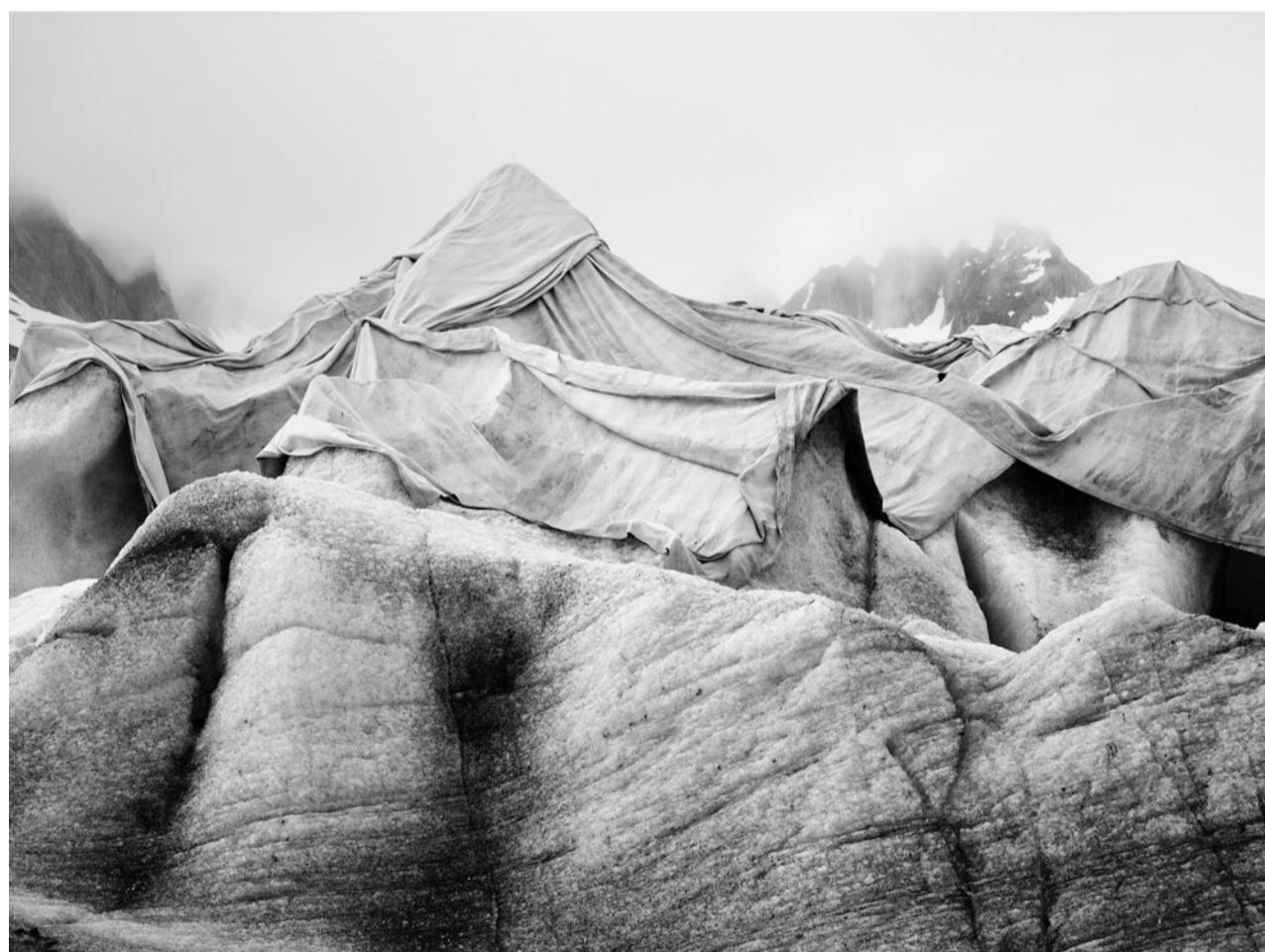
Abdeckungen aus Vlies sollen den Gletscherschwund bremsen: der Rhonegletscher am Furkapass.

Zu wenig weit geht die Vorlage Vertretern des Klimastreiks aus der Romandie, die ein Netto-null-Ziel für Treibhausgasemissionen nicht erst bis 2050, sondern spätestens bis in zehn Jahren fordern. Aktivisten halfen bei der Sammlung der Unterschriften für das Referendum, das im Januar eingereicht wurde.