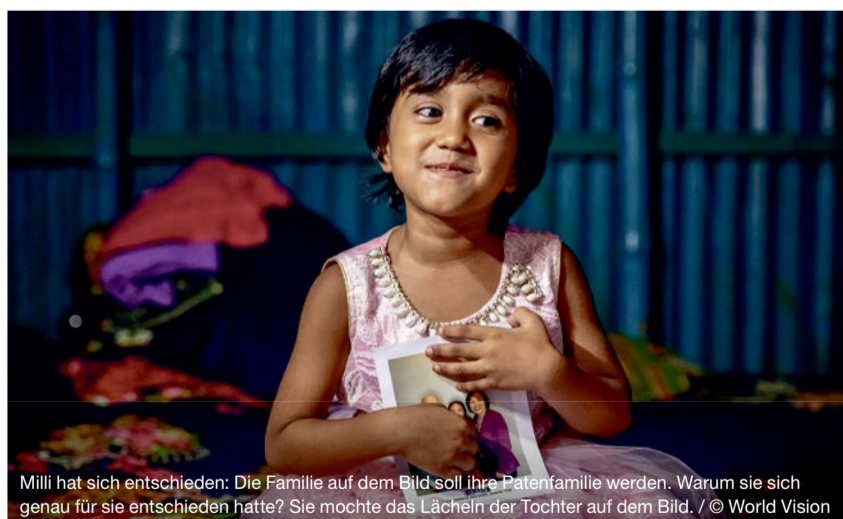
Milli hat sich entschieden: Die Familie auf dem Bild soll ihre Patenfamilie werden. Warum sie sich genau für sie entschieden hatte? Sie mochte das Lächeln der Tochter auf dem Bild.

Gerade in der aktuellen Situation fehlt uns vielleicht manchmal die Hoffnung. Doch genau daran erinnern wir uns am Ostersonntag – und vielleicht auch daran, dass andernorts Hoffnung noch viel ferner liegt.