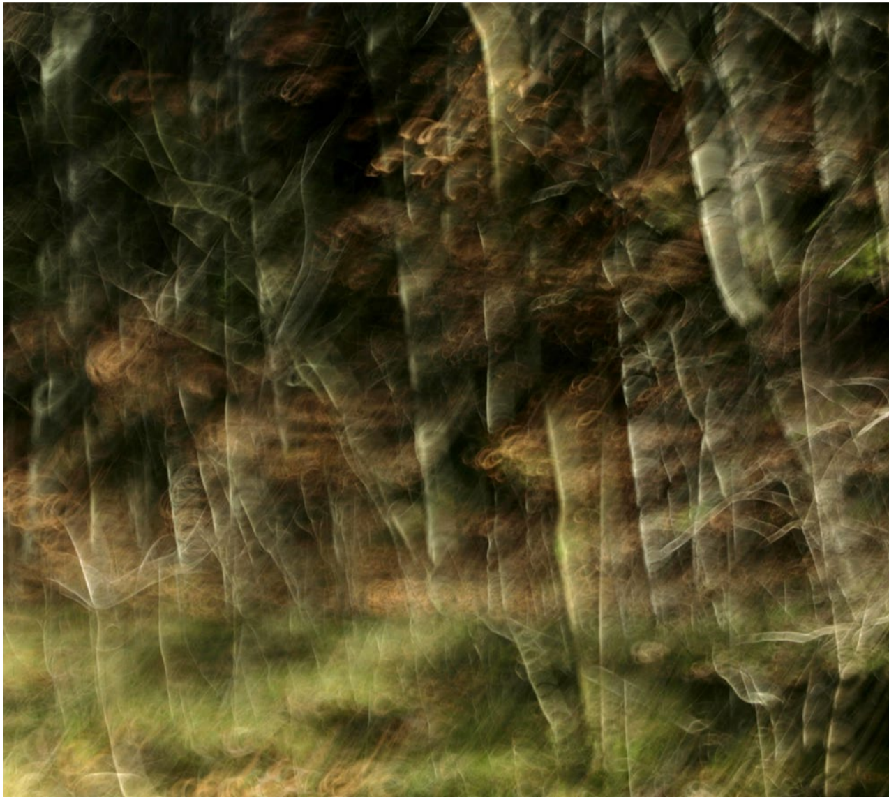
Wer mit dem sechsten, siebten oder achten Sinn sieht, nimmt die Dinge anders wahr.