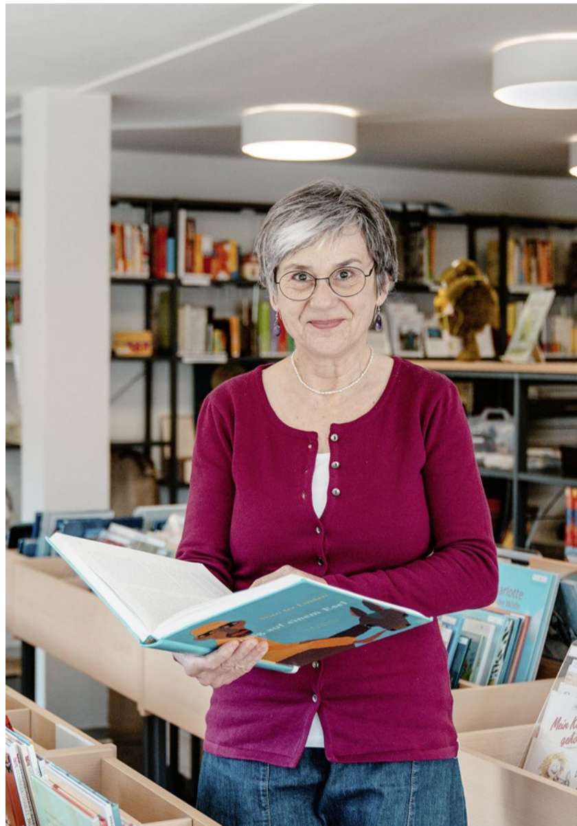
Die Bibliothek im Haus der Kirche bietet viel Lesestoff.

Kinder haben uns etwas Wichtiges voraus: Sie können staunen. Sie fra-