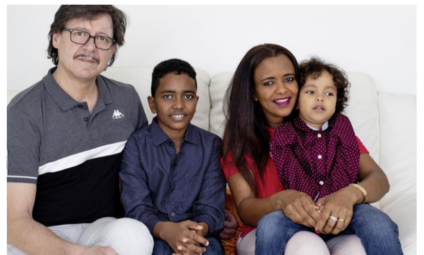
Die glücklich vereinte Familie.