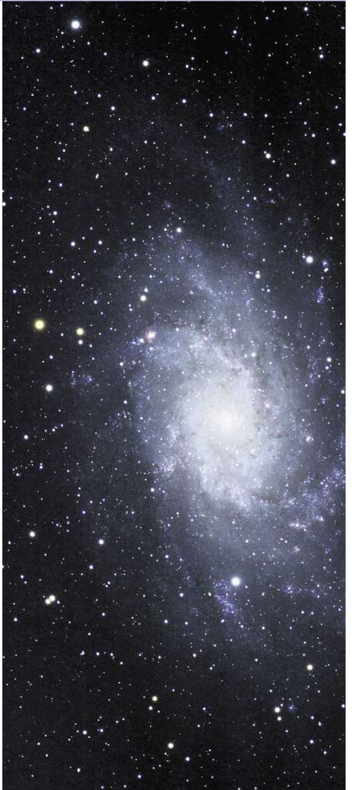
Triangulum-Galaxie im Sternbild Dreieck, aufgenommen in einer Oktonacht 2005 auf dem Gurnigelpass