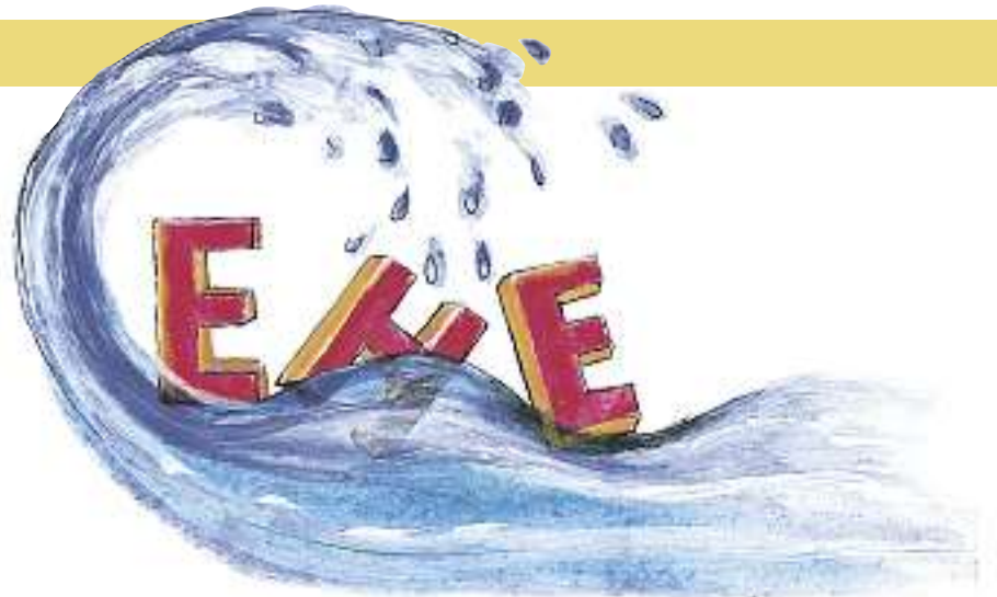
ILLUSTRATION: VERENA STUMMER

Vergessen Sie deshalb das Illustrierten-Märchen vom harmlosen Kavaliersdelikt. Auch wenn viele etwas tun, muss es damit noch nichts Gutes sein. Sie müssen Ihre Gefühle zu Ihrer neuen Bekanntschaft deswegen nicht «abwürgen» und sich selber gegenüber unwahrhaftig werden. Sie dürfen sich eingestehen, was Sie fühlen, ohne sich deswegen zu schämen. Aber ausleben müssen Sie diese Gefühle damit noch lange nicht. Denken Sie daran: Gefühle sind kurzlebig. Deshalb ist das siebte Gebot ein Schutzraum für die langlebige Liebe in der Ehe.