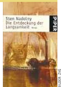
STEN NADOLNY. Die Entdeckung der Langsamkeit. München 1983 Piper Verlag ISBN 3-492-20700-6