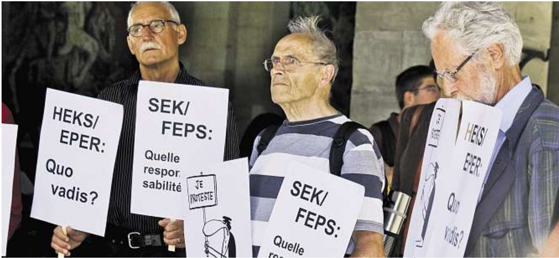
Wie weiter mit dem Hilfswerk der Evangelischen Kirchen Schweiz (Heks)? Die Gruppe «Heks – quo vadis?» protestiert in Gené