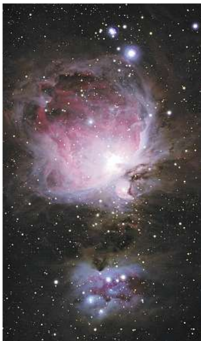
Grosser Emissions- und Reflexionsnebel im Sternbild Orion, aufgenommen im Dezember 2006 auf dem Gurnigelpass

WILLIGIS JÄGER (84) ist Benediktinermönch und Zenmeister.