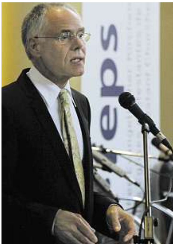
«Markt und Ethik verbinden»: Moritz Leuenberger

GLAUBWÜRDIGKEIT. Will man den Protest der dritt-weltengagierten Kirchenbasis aussitzen und die Kritiker zermürben? Sollte das gelingen, verliert das Heks eine zwar aufmüpfige, aber sehr treue Gefolgschaft. Gelingt es nicht, wird das Heks die Glaubwürdigkeitsdiskussion nicht los. Der Kirchenbund ruft zum «verantwortungsvollen Umgang mit Kritik auf». Wo bleibt aber der verantwortungsvolle Umgang mit den Kritikern?