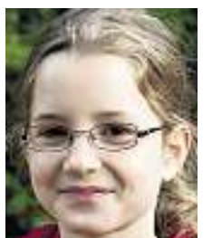
HELENA, 9 «Ich möchte einmal einen Stern in die Hand nehmen.»