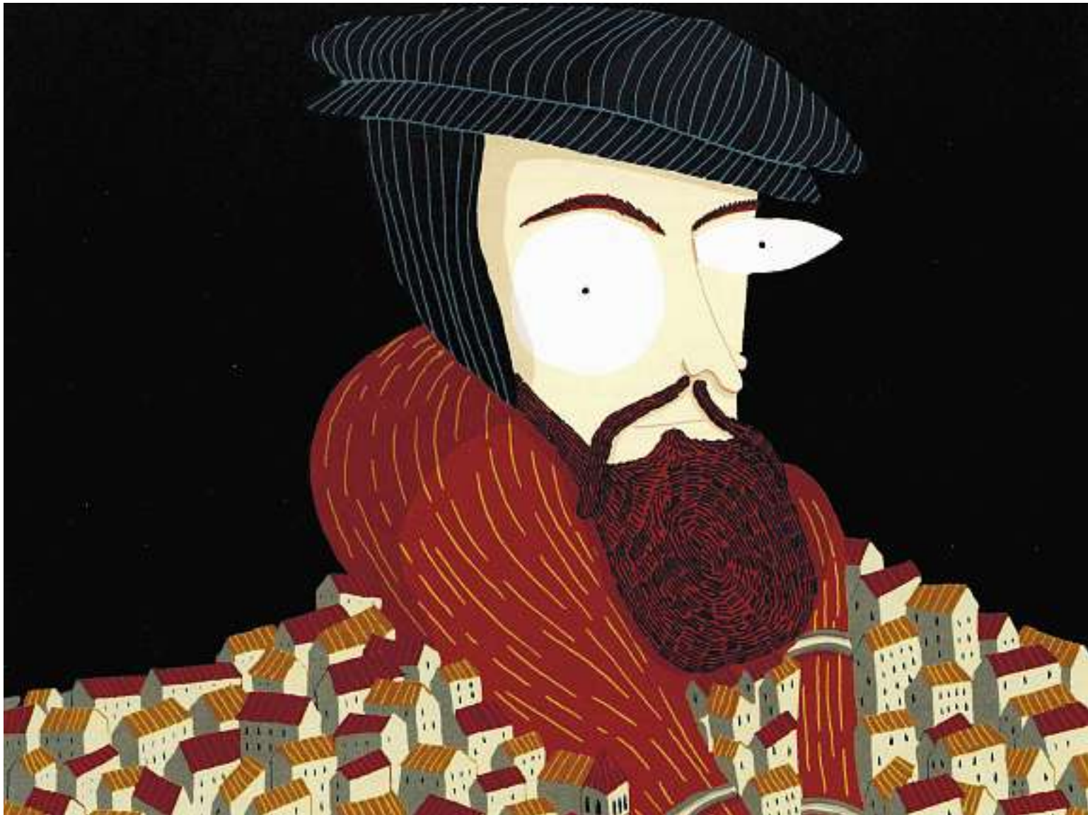
Der Reformator im «calvindrier» (Verballhornung von «calendrier»), der zum 500-Jahr-Jubiläum erschienen ist