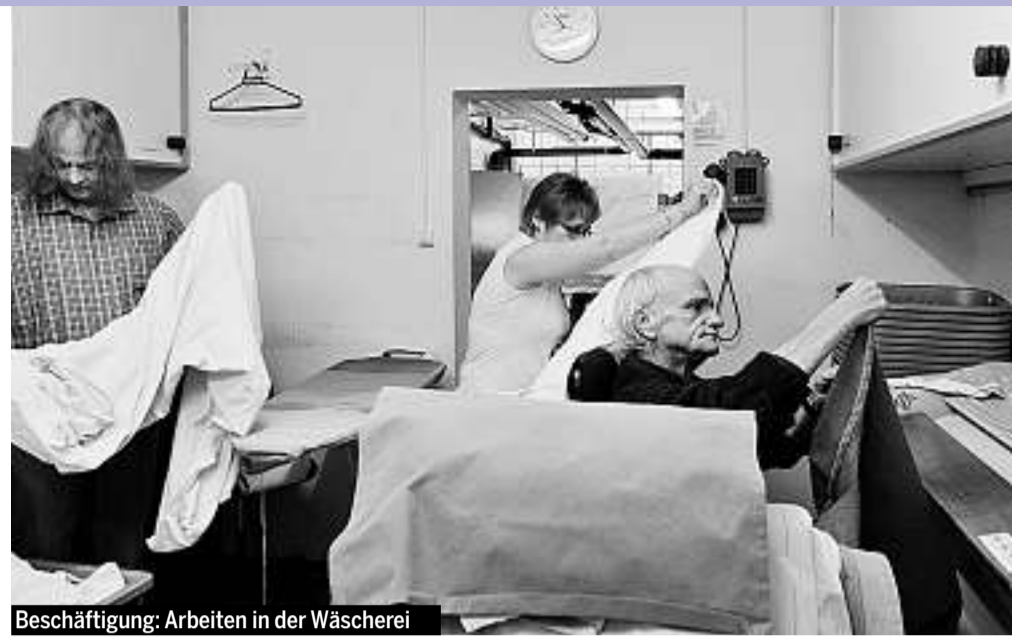
Beschäftigung: Arbeiten in der Wäscherei

*Die Namen aller Bewohner sind geändert.