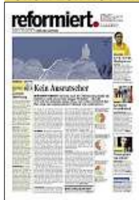
REFORMIERT. 11/10: Dossier Minarettverbot war kein Ausrutscher