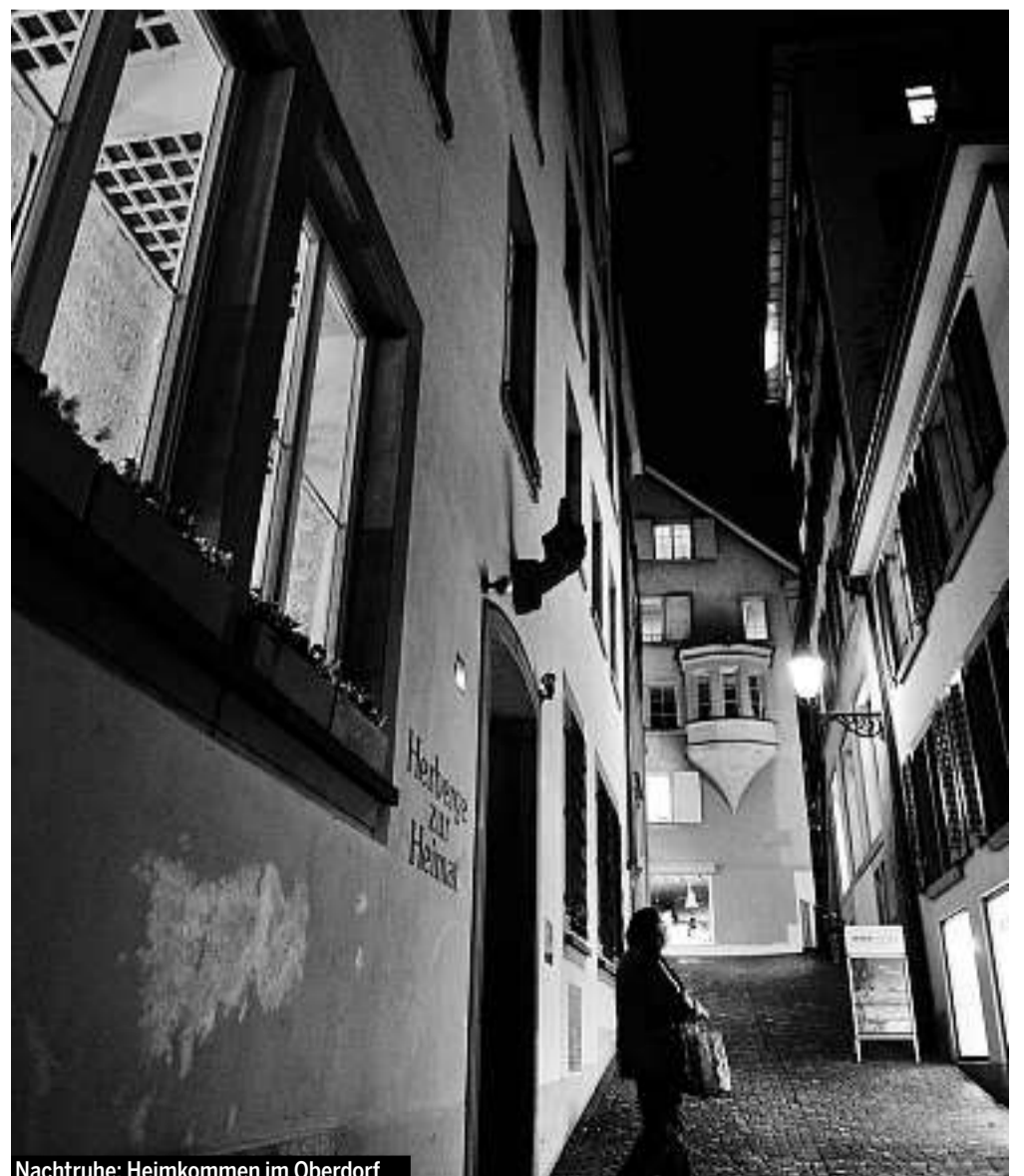
Nachtruhe: Heimkommen im Oberdorf