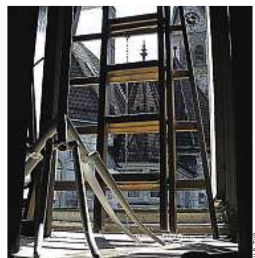
Gesamtkirchengemeinde Bern: Bald eine Baustelle?

heute noch rund 60 000 Personen. Zwölf Kirchgemeinden betreuen zwischen 1200 und 8000 Mitglieder. Jede Kirchgemeinde hat einen eigenen Kirchgemeinderat, ein eigenes Budget und ein eigenes Team von Angestellten. RITA JOST