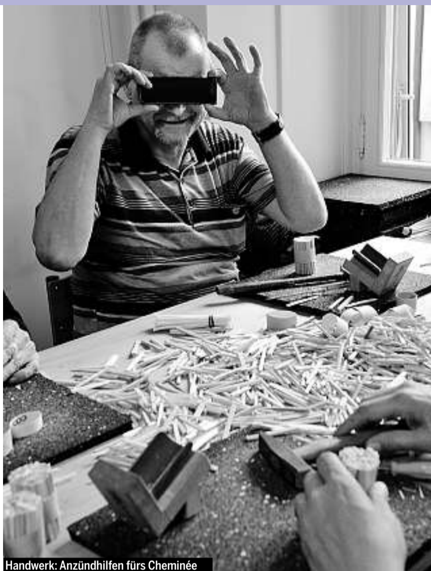
Handwerk: Anzündhilfen fürs Cheminée