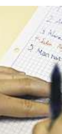
Gruppenarbeit: Beter schreiben die meiste

Die «Schalke-Bibel» ist übrigens wirklich eine Bibel, mit Altem und Neuem Testament und Psalmen, ergänzt durch persönliche Glaubensgeschichten von Managern und Spielern des Clubs. Fussball und Religion ist also das Thema der Doppel-