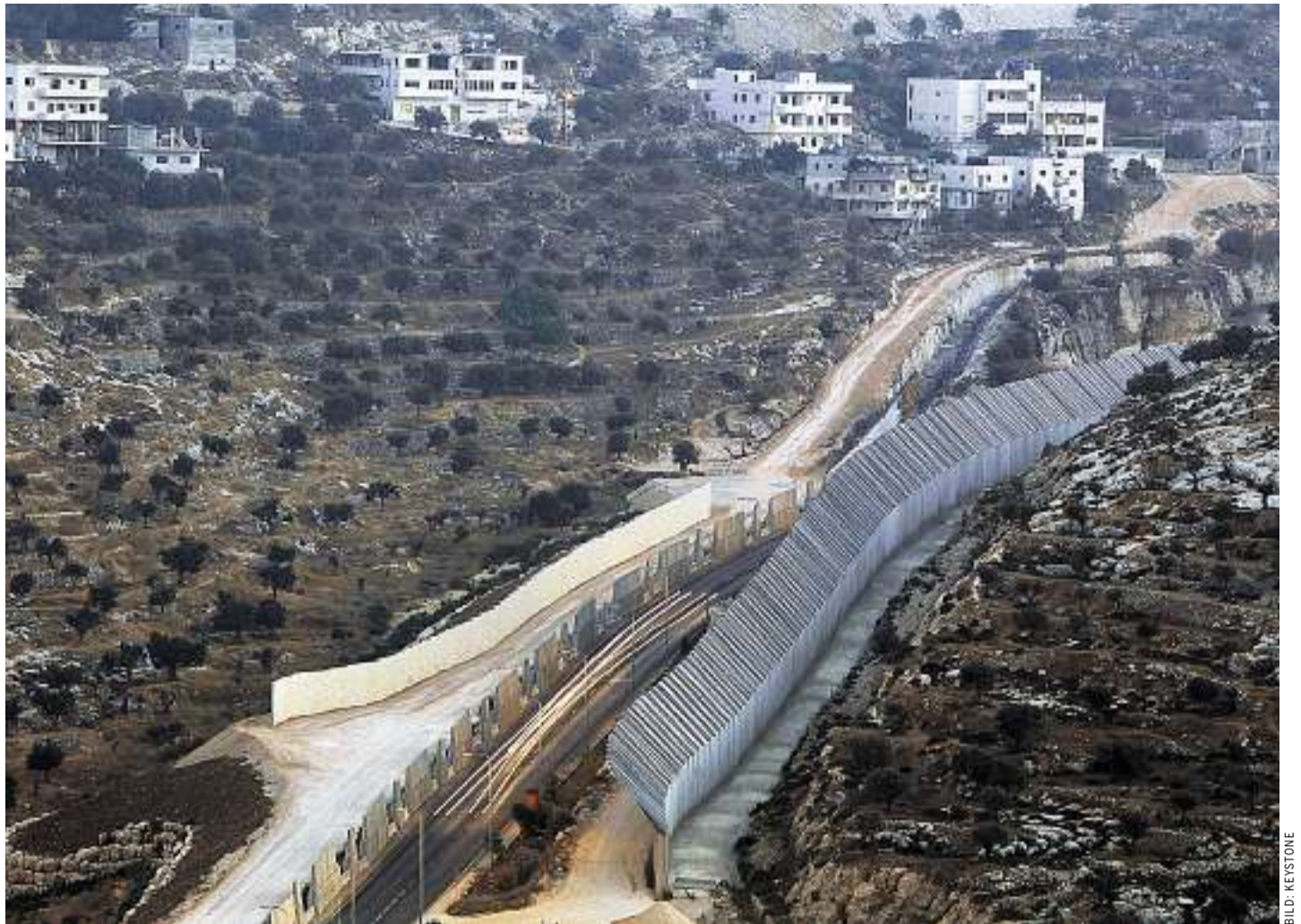
Eine Mauer trennt die palästinensischen von den israelischen Gebieten ab – hier beim Ort Beit Jala im Westjordanland

PALÄSTINA/ Mit dem Appell «Kairos Palästina» machen palästinensische Christen auf ihre schwere Situation aufmerksam. Lange ging ihr Ruf unter. Jetzt reagieren die Evangelische Landeskirche Zürich und das Heks.