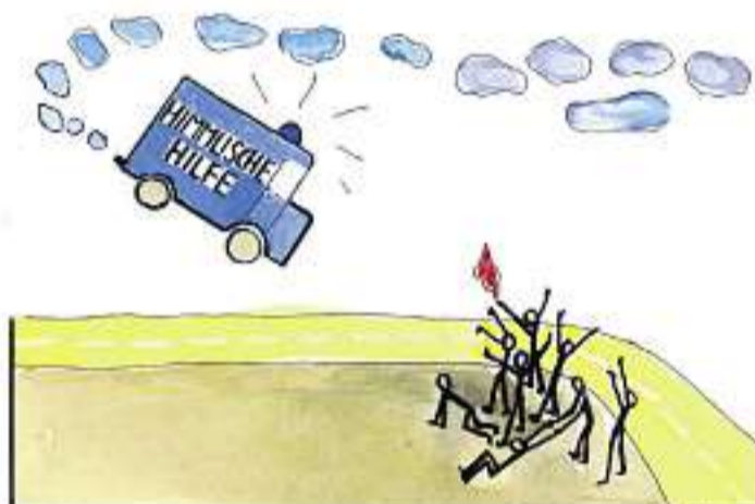
ILLUSTRATION: VERENA STUMMER

SENDEN SIE Ihre Fragen an: «reformiert.», Lebensfragen, Postfach, 8022 Zürich lebensfragen@reformiert.info