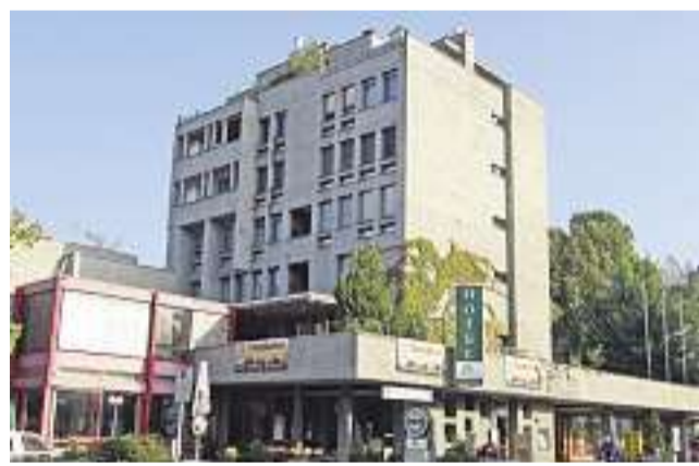
Früher teilweise als Kirchgemeindehaus genutzt, jetzt Spekulationsobjekt: Hotelkomplex Drei Linden in Wetzikon

SCHULUNG. Obschon eigentliche Richtlinien dazu noch fehlen, ist die Zürcher Landeskirche auf dieses Dilemma vorbereitet und spricht das Thema an den Behörden-schulungen an. An einer Impulstagung im Oktober 2009 zur «sozialen, ökonomischen und ökologischen Verantwortung» des kirchlichen Grundbesitzes wurde die