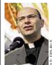
MITRI RAHEB (49) ist Mitautor des Kairos-Dokuments, Pfarrer an der Weihnachtskirche Bethlehem und Gründer eines dortigen Begegnungszentrums.