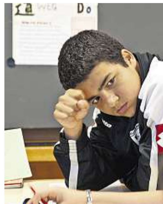
Ein Donnerstagmorgen in der Sekundarschule Stettbach: Was haben Fussball und Religion gemeinsam? Was sind Rituale? Die Schülerinnen und Schüler sind engagiert bei der Sache im neuen Schulfach «Religion und Kultur».