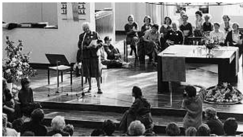
«Worauf warten wir noch?» – Marga Bührig spricht 1987 in Luzern am Ersten Schweizer Frauenkirchfest

GEGEN MÄNNERDOMINANZ. Die 36-seitige Broschüre «Zwischen Evangelium und Politik» beleuchtet den Werdegang der EFS seit ihren Anfängen bis heute. In den 1950er-Jahren setzten sich die EFS zum Ziel, für Frauen wichtige Fragen aus evangelischer Perspektive zu beantworten. Die evangelische Theologie kam damals dem Wunsch der Frauen nach mehr Rechten im öffentlichen Leben wenig entgegen; der Bezug aufs Evangelium wirkte sich in den