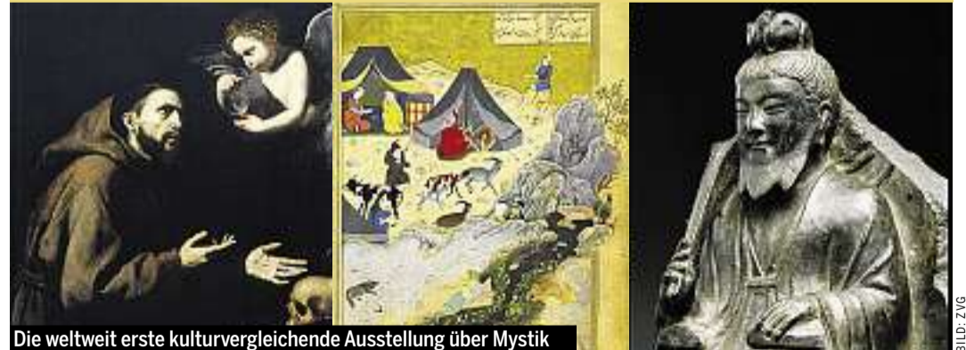
Die weltweit erste kulturvergleichende Ausstellung über Mystik