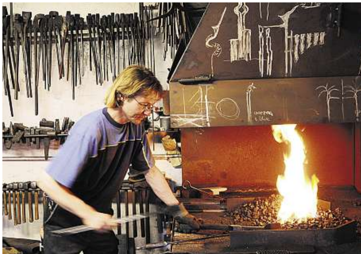
Sein eigenes Geschäft aufbauen mithilfe der Bürgschafts- und Darlehensgenossenschaft