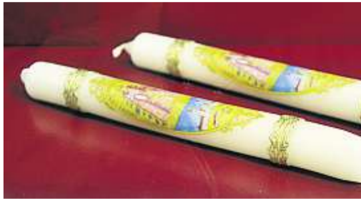
Wetterkerzen werden zum Schutz gegen Unwetter angezündet