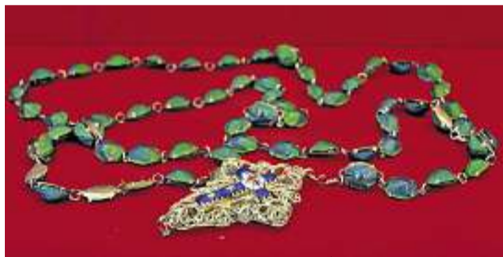
Der Rosenkranz aus Käfern soll gegen psychische Störungen («Hirnkäfer») geholfen haben