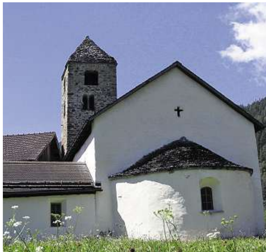
Der Weiler San Niclò liegt in der Nähe von Tschlin, auf der rechten Innseite

GEPREDIGT am Betttag, 18. September 2011 in Valzeina