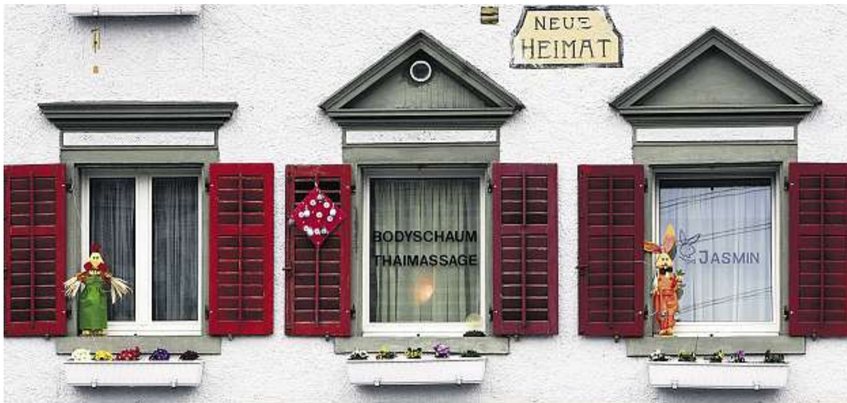
Neue Heimat im Bordell: Unauffälliges Sexetablisement mit Häschendeko im Kanton Luzern