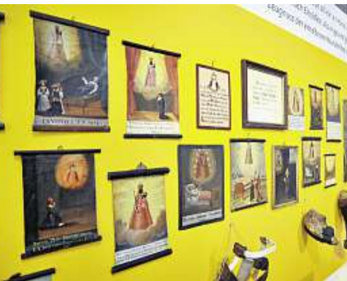
Ex Votos: Bilder, Gaben von Gläubigen zum Dank für erhaltene Hilfe

FURCHT. Die Angst vor Unwettern prägte den Volksglauben stark. Mit Gegenständen wie Wettersegenblättern, Wetterkerzen oder Wetterglöcklein versuchte man, sich dagegen zu schützen. «Noch heute gibt es Wetterglocken in der Kirche in Falera», weiss Tanner. Sie wurden bei Sturm- wetter geläutet. Wettersegenblätter wurden bis ins 19. Jahrhundert gedruckt. Wenn ein schweres Gewitter losbrach, versammelte man sich in der Stube und versuchte, durch lautes Beten die Gefahr abzuwen-