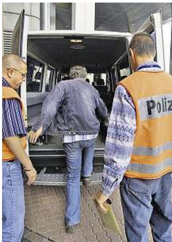
Ausschaffungen beobachten: Der Kirchenbund engagiert sich