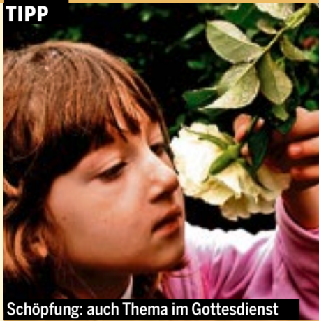
Schöpfung: auch Thema im Gottesdienst