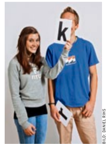
Jugendliche leben Ökumene vor

chen im eigentlichen Sinn. Klarer kann man es nicht sagen: Eine Ökumene des katholischen Klerus mit der reformierten Kirche ist eine Unmöglichkeit. Aber im Alltag gibts zwischen katholischem und reformiertem Volk keine grundsätzlichen Probleme, und unterschiedliche Ansichten sind anregend und kreativ. Allerdings muss gesagt sein, dass krasse Unterschiede – wie: keine gleichen Rechte für Frauen, Unfehlbarkeit des Papstes, der widernatürliche Zölibat (mit Tausenden wegorganisierter Priesterkinder) – unerträglich sind und es wahrlich an der Zeit wäre, mit Stéphane Hessel zu rufen: «Indignez-vous!». Ja, empört euch endlich! PETER GASSER, LIEBEFELD