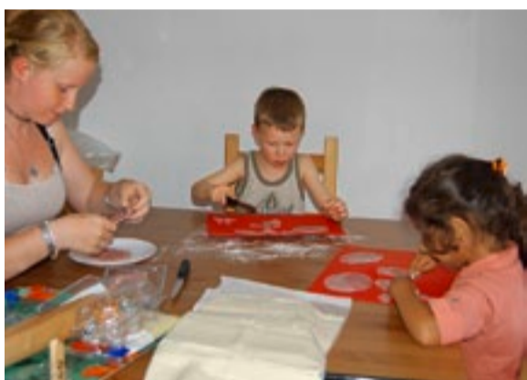
Gemischte Altersgruppen: Kinder lernen so voneinander