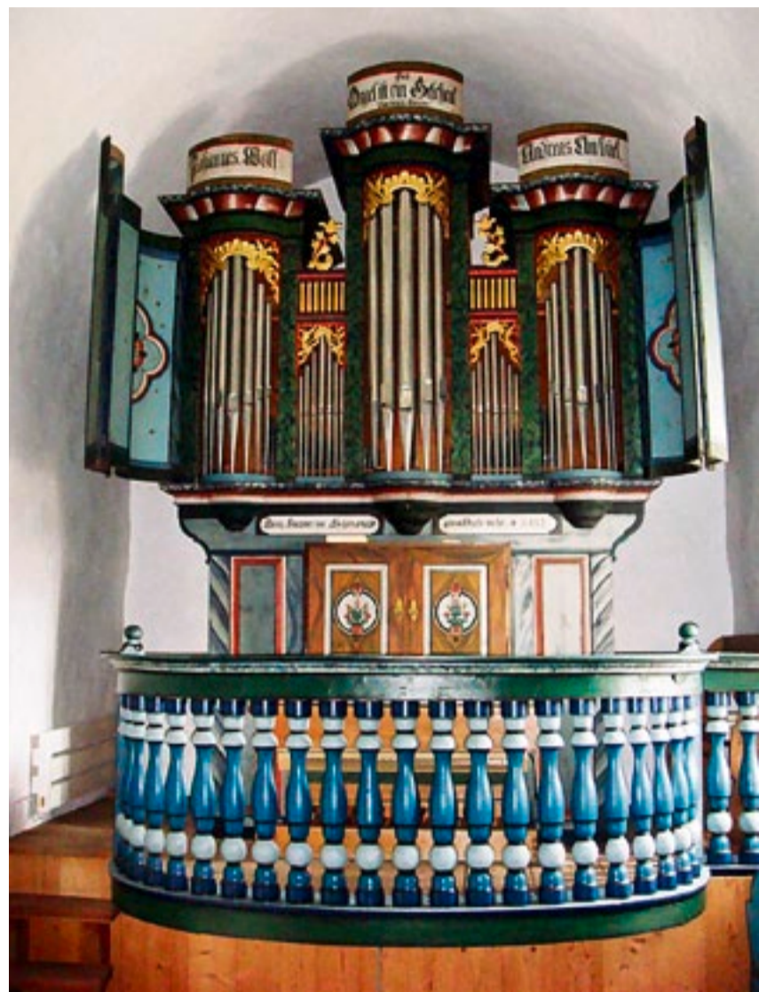
Eine der vier Hammer-Orgeln in der Schweiz: die Orgel der Kirche St. Niklaus in Glaris

MUTIG. Für Glaris und deren Feriengewohner ist die Kirche nicht nur historisch wertvoll, sondern ein wichtiger Ort der Begegnung. «Hier steht die Kirche noch im Dorf», meint Schoop. Nicht nur buchstäblich; während die Fraktionsgemeinde Glaris aus Spargründen viele ihrer Aufgaben abgeben musste, funktioniere das Leben der Kirchengemeinde weitgehend unverändert, so Schoop. Konzerte, Weihnachtsspiele, Neujahrsbegrüssung: «In dieser Kirche wird Gemeinschaft gelebt.» Wie wichtig den Glarisern ihre bunte Orgel ist, zeigte sich auch bei der letzten Generalrevision. Diese wurde mitten in den Kriegsjahren 1943/44 durchgeführt, um das vom Zerfall bedrohte Instrument zu retten. RITA GIANELLI