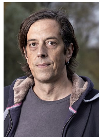
Autor Pedro Lenz.

quem sein, nicht aber für Mitmenschen, die mein Wort nötig haben.» Eine gute Predigt sei stets eine Herausforderung, sagt Lenz. Für ihn. Und für die Gemeinde. Felix Reich