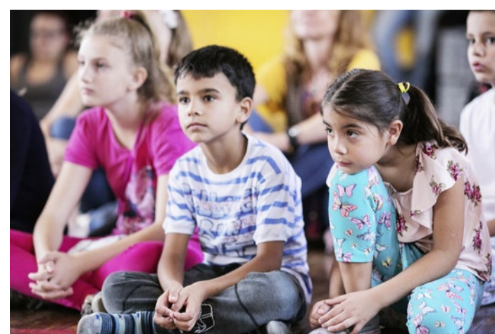
Warten auf die Vorstellung des Zirkus Lollypop.