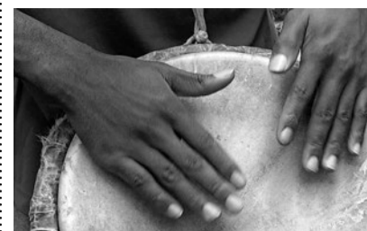
Trommeln für die Seele.