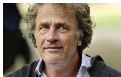
Alex Capus