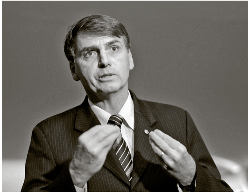
Ist Jair M. Bolsonaro bald Brasiliens Präsident?

«Mit moralischen Fragen zu Abtreibung und Homosexualität hat er die pfingstlerische und evangelikale Wählerschaft mobilisiert», analysiert der Schweizer Theologe Rudolf von Sinner, der seit 15 Jahren an der Theologischen Hochschule «Faculdades EST» im brasilianischen