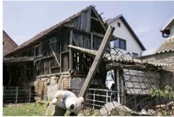
Der verwahrloste Hinterhof dient als Spielplatz.