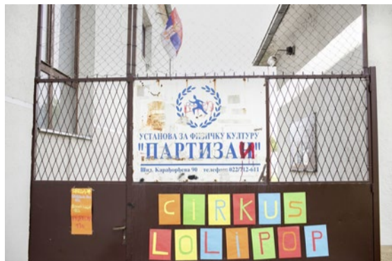
Plakat am Eingang des Sportzentrums.