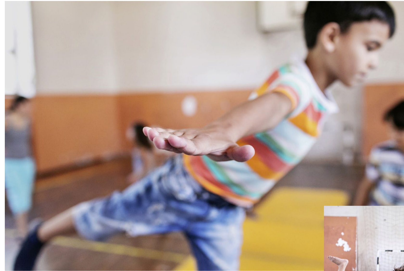
Balancieren auf einem Bein braucht Konzentration und Präzision.