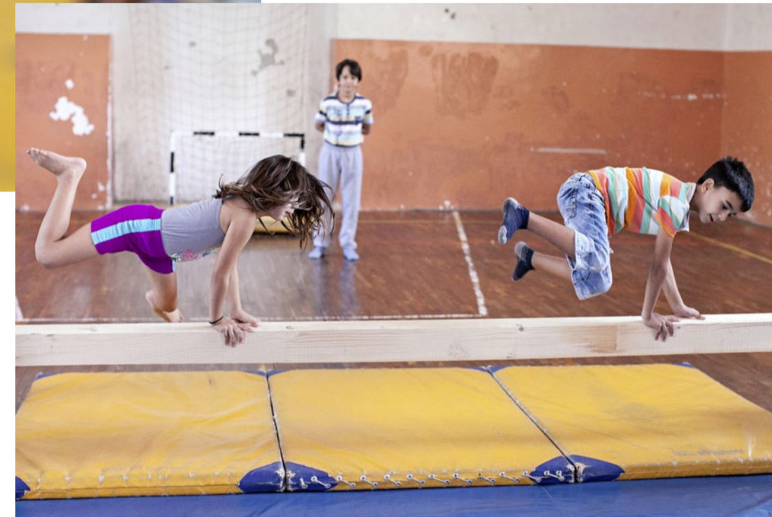
Aufwärmen für das Akrobatiktraining im Sportzentrum Partisan.