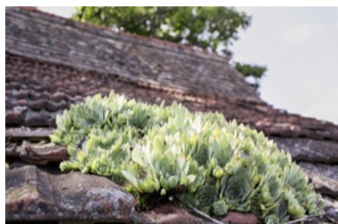
Glückspflanze: die Čuvarkuća.