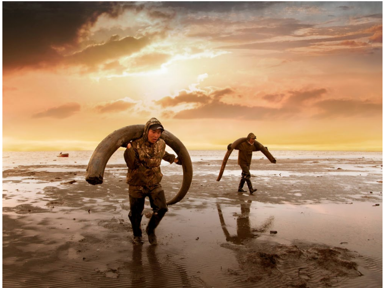
Auf der Suche nach Mammustosszähnen: Jakuten auf den Neusibirischen Inseln.